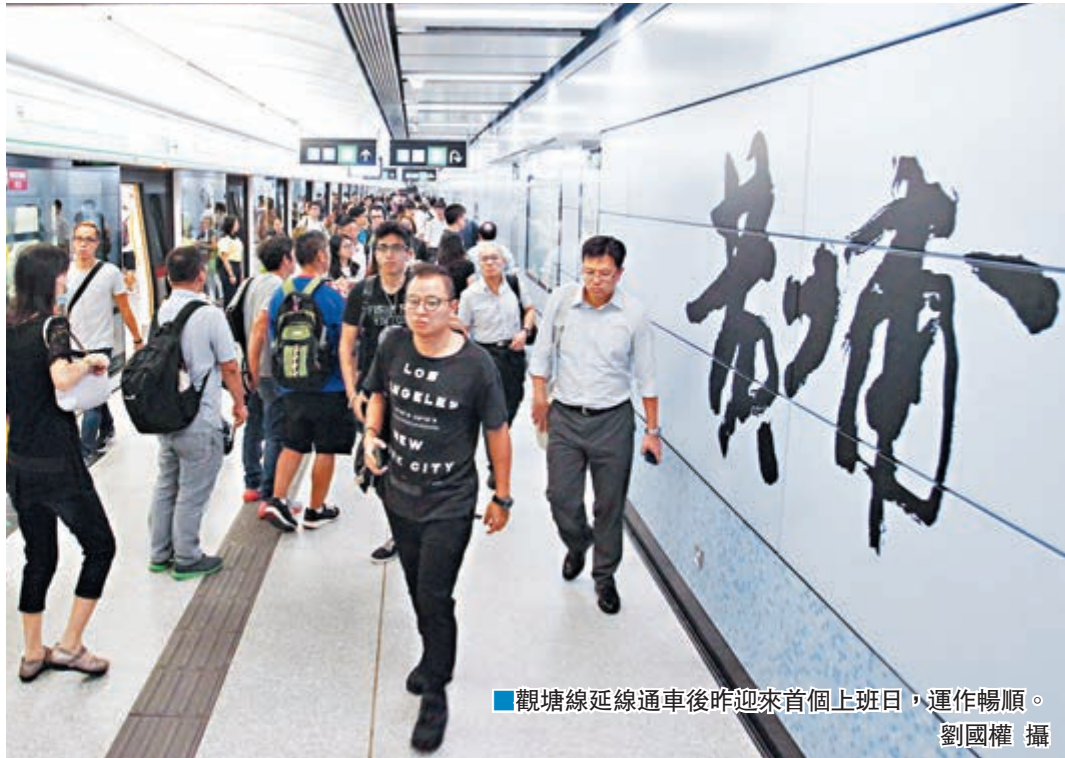
觀塘延線通車後昨迎來首個上班日,運作暢順。

香港文匯報訊(記者 莊禮傑)港鐵觀塘線延線日前通車,在昨日首個工作天早上未受考驗,運作大致暢順。港鐵在新站及不同轉車站均有加派人手維持秩序,指乘客轉車過海數量比以往多,但等候時間相若。在黃埔站,有選搭港鐵市民直言新線更方便舒適,亦有人指延線給予居民多一個選擇,會視乎情況選擇交通工具。