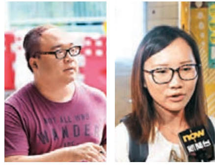
周小姐:首數天仍會選搭小巴。