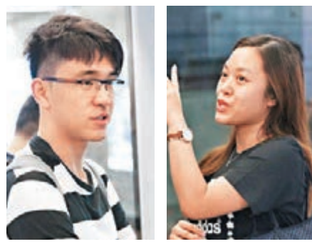
馬小姐讚省卻上班轉車時間。