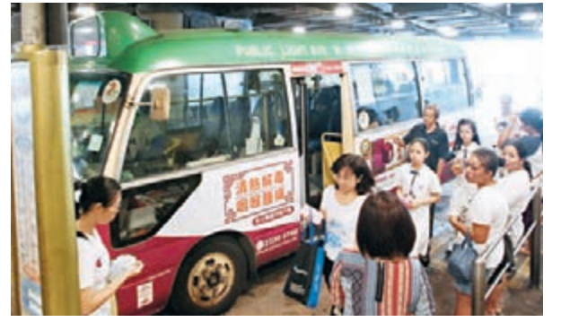
港鐵延線開通影響其他交通工具生意,鄰近黃埔的小巴站務員估計昨日乘客量減半。

前日開通的觀塘線延線於昨日第一個工作天早上運作大致暢順,黃埔站在早上繁忙時間未見人潮,港鐵派出不少人手在站內各出入口、大堂及月台協助乘客,例如職員在大堂協助市民使用售票機購票;當列車抵站後亦有人在月台向下車乘客指示各個出入口。