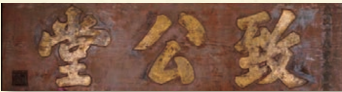
(圖二) 19世紀末美國加州軒佛市致公堂的區額。(軒佛廟宇保育委員會藏)