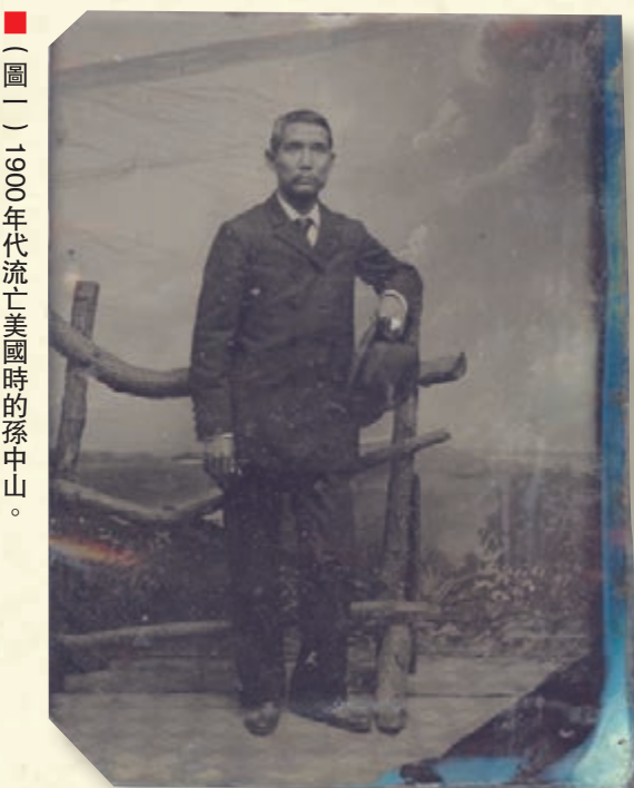
(圖一) 1900年代流亡美國時的孫中山。