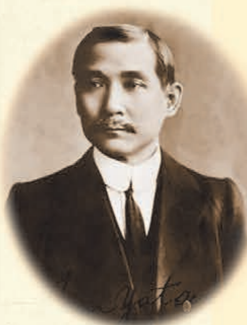
圖文：香港歷史博物館