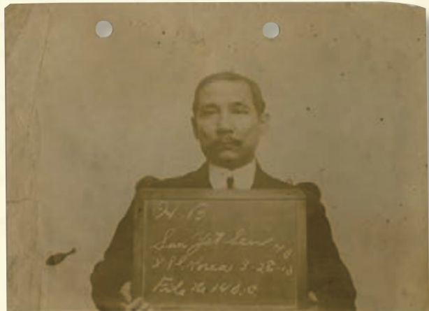
(圖五) 孫中山於1904年4月入境美國時，曾經一度被美國移民局拘留。

與此同時，本展覽亦從美國加州的軒佛市借來當地僑領、廣東番禺人蘇柏棠(圖六)的相關文物，從中展示出當年海外華僑與中國內地的密切聯繫，廣大華僑對中國革命的鼎力支持。蘇柏棠於1886年在軒佛市開設蘇松記雜貨店(圖七)，經營雜貨、中醫及匯兌業務，與香港的銀號常有生意往來。特別值得一提的是，蘇柏棠於辛亥革命期間購買了中華革命軍籌餉局的債券(圖八)，民國成立後，蘇松記更掛上中華民國在北伐前使用的五色旗(圖九)，以示對中國革命的支持。透過這些難得的文物，觀眾可以體會到海外華僑如何心繫祖國，並如何身在彼邦，心懷救國壯志，千方百計投身波瀾壯闊的革命運動，盼望振興中華。