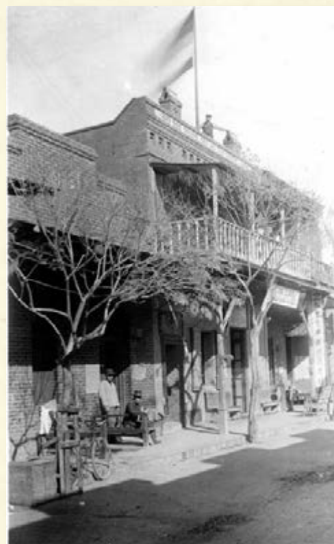
(圖九) 民國年間的軒佛市蘇松記懸掛起五色旗；五色旗是1912年至1928年的中華民國國旗。