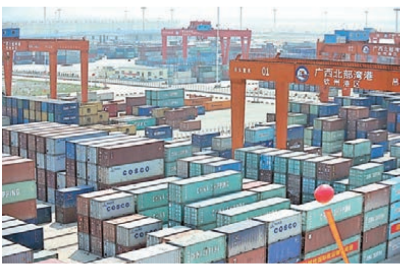
分析指出,出口股及香港工業股有望受惠於人民幣下調。

事實上,一個國家或地區的貨幣貶值,必有正反兩面影響,並非一面倒不利經濟發展。投行高盛最新的報告透露,該行統計所有上半年錄得外匯收益或虧損的港股,並研究他們收入對外匯的敏感度後,發現有人民幣貶值下,投資者留意一些收入來自海外、成本以人民幣計價的股份,例如出口、科技與工業股。另外,人民幣貶值將會讓資金從內地樓市流出,以美元或港元計價的保險,或是豪宅將成為