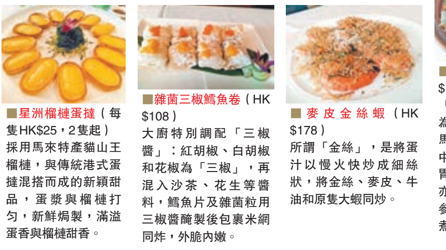
星洲榴槿蛋撻 (每隻HK$25, 2隻起) 採用馬來特產貓山王榴槿，與傳統港式蛋撻混攪而成的新穎甜品，蛋漿與榴槿打勻，新鮮焗製，滿溢蛋香與榴槿甜香。 雜菌三椒鱈魚卷 (HK$108) 大廚特別調配「三椒醬」：紅胡椒、白胡椒和花椒為「三椒」，再混入沙茶、花生等醬料，鱈魚片及雜菌粒用三椒醬醃製後包裹米網同炸，外脆內嫩。 麥皮金絲蝦 (HK$178) 所謂「金絲」，是將蛋汁以慢火炒成細絲狀，將金絲、麥皮、牛油和原隻大蝦同炒。

從「星味」來說，由新加坡的資深名廚張偉忠坐鎮，張偉忠現任新加坡中廚協會會長，曾任職新加坡歷史悠久的「長堤海鮮樓」20多年，該店所創製的辣椒蟹、黑椒蟹獲奉為新加坡國菜，為星洲首屈一指的名廚。他應邀擔任客席大廚，帶來多款正宗獅城風味名菜，如許多港人在新加坡必食的辣椒蟹與黑椒蟹、香脆惹味的麥皮金絲蝦、亞參咖哩魚頭、啡香撲鼻的杏片咖啡排骨，以及以貓山王製成的星洲榴槿蛋撻等甜點。 試食後，很多人都對辣椒蟹與黑椒蟹讚好，問如何煮？張師傅表示首推調味，調味購自新加坡和大馬，而選蟹方面，兩者均嚴選產地直送的優質斯里蘭卡野生肉蟹烹製，因斯里蘭卡野生肉蟹有肉質鮮美的好處。今次正宗的星洲辣椒蟹與黑椒蟹售價肯定比其他辣蟹店便宜，食客絕對不容錯過。