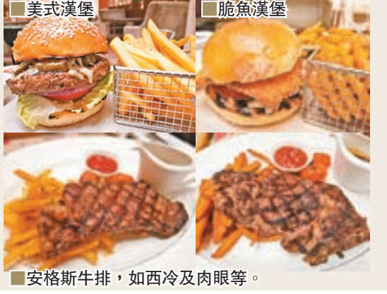
美式漢堡 脆魚漢堡 安格斯牛排，如西冷及肉眼等。

至於「全澳牛排美饌優惠之最」則提供多款8安士優質安格斯牛排，配以新鮮沙律、香脆薯條及精選醬汁，價格僅為澳門幣198元，實為饕客之選。你還可以投己所好挑選心水牛排，如肉眼牛排、西冷牛排及牛里內脊肉，更可另加澳門幣38元選購配菜，如蘆筍、蘑菇及奶油菠菜，與親朋好友共聚一堂細味晚上輕鬆美饌時光。