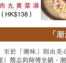
砂鍋魚皮餃肉丸黃菜湯 (HK$138)