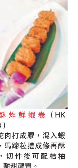
酥炸鮮蝦卷 (HK$98) 五花肉打成膠，混入蝦肉、馬蹄粒搓成條再酥炸，切件後可配柚柚汁，酸甜醒胃。