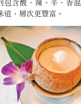
椰皇杏汁雪糕 (每位HK$58) 以純椰皇水、椰子肉及椰漿混合冷凍而成，配鮮磨杏汁及椰子味雪糕，濃郁椰香配合杏香，格外清甜滋潤。