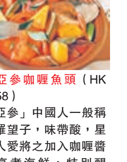
亞參咖哩魚頭 (HK$158) 「亞參」中國人一般稱為羅望子，味帶酸，星馬人愛將之加入咖哩醬中烹煮海鮮，特別醒胃。這道「咖哩魚頭」亦特別利用馬來產的亞參醬與魚咖哩粉烹煮，酸中帶辣。