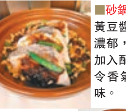
砂鍋黃豆醬焗斑扒 (HK$178) 黃豆醬是潮菜主要醬料之一，醬香濃郁，多用以烹煮海鮮，將黃豆醬加入配料與石斑扒生焗，砂鍋熱力令香氣充分滲透材料中，濃郁入味。