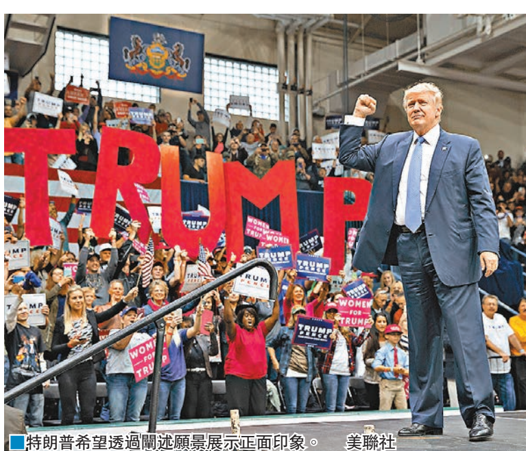
■ 特朗普希望透過闡述願景展示正面形象。

說會在「特別的地方度過特別的一天」。蓋茲堡對共和黨別具意義，該黨首位總統林肯 1863 年便是在此發表著名的《蓋茲堡演說》，但特朗普與林肯發表演說的地點並不相同。 特朗普前晚在賓夕法尼亞州拉票時又表示，一旦當選總統，便會在賓夕法尼亞州等地建造 3 艘新戰艦，並承諾會採用「美國鋼鐵」。