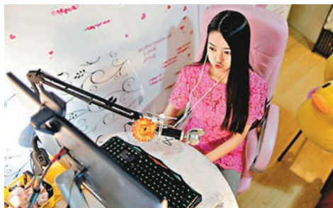
■ Mirai 惡意程式能夠入侵網絡鏡頭，讓黑客遠距操控發動攻擊。

「Mirai」上月曾攻擊知名電腦保安專家克雷布斯的網站，黑客組織於本月初在網上公開「Mirai」的程式碼，吸引大批黑客下載，專家擔心類似攻擊今後或陸續有來。暫時未知「Mirai」是由誰人研發，「Mirai」一字在日文意指「未來」，而公開程式碼的用戶也利用一個日本動漫角色作為頭像。 ■《衛報》