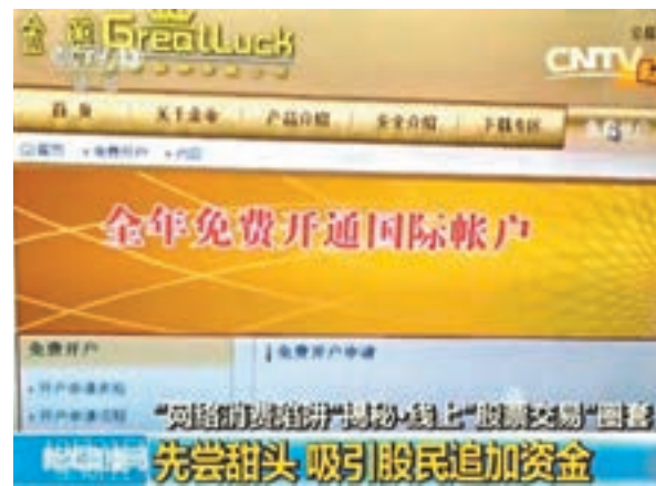
詐騙團夥以網絡股票交易平台行騙。