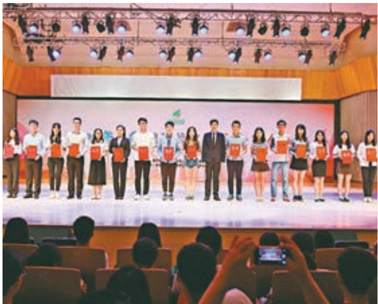
「展翅計劃」中的優秀實習代表接受獎狀。

香港文匯報訊(記者敖敏輝廣州報道)針對大學生就業難現狀,廣東啟動「展翅計劃」,為在校及畢業生提供實習和就業機會。記者從昨日舉行的2016年「展翅計劃」廣東大學生就業創業能力提升行動招聘會獲悉,今年「展翅計劃」發動15,480家用人單位上線發佈122,055個崗位。截至目前,自啟動以來,該計劃已經累計服務超過120萬名大學生。