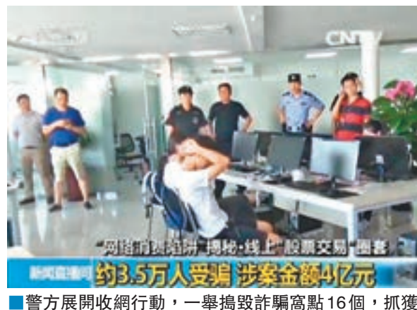
警方展開收網行動,一舉搗毀詐騙窩點16個,抓獲疑犯369人。

的軟件依舊如出一轍。然而,股民只要投資進來,資金就會被各種隱性收費扣掉。警方調查發現,為了讓股民在平台上每天頻繁地