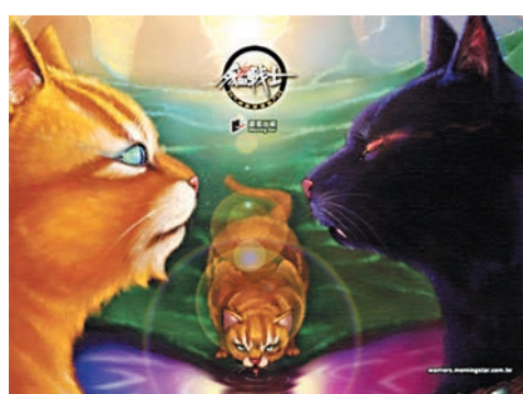
阿里影業計劃將《貓戰士》打造成世界級的奇幻電影巨製。

香港文匯報訊 阿里影業（1060）昨宣佈，於第68屆法蘭克福國際書展上，與英國Working Partners公司及其母公司Coolabi集