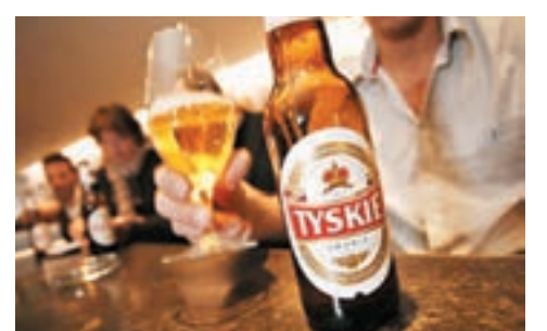
傳潤啤有意競投百威英博集團東歐啤酒業務，包括波蘭的Tyskie啤酒品牌。

協議，以16億美元（相當約124.4億港元）購買SABMiller所持華潤雪花的49%股權，並於本月12日完成收購。