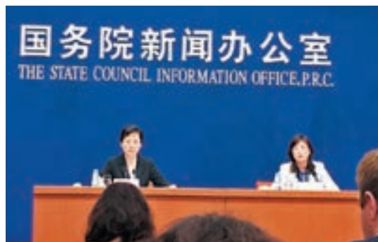
國家外匯管理局新聞發言人王春英（右）在國新辦記者發報會上回應外匯熱點話題。

香港文匯報訊（記者 海巖 北京報道）雖然人民幣不斷貶值，但境外投資者對人民幣產品的需求反而有所上升。國家外匯管理局新聞發言人王春英透露，今年前9月，境外投資者累計增持中國國債、央票、股票等人民幣資產近3,800億元(人民幣，下同)，較去年大幅增長。並表示，歡迎境外投資者參與境內金融市場，並且不會限制資金流出。