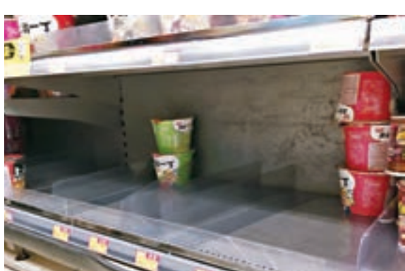
超市貨架上的杯麵,幾乎被人搶購一空。