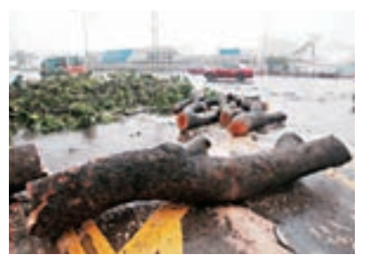
銅鑼灣有大樹倒塌令道路受阻。