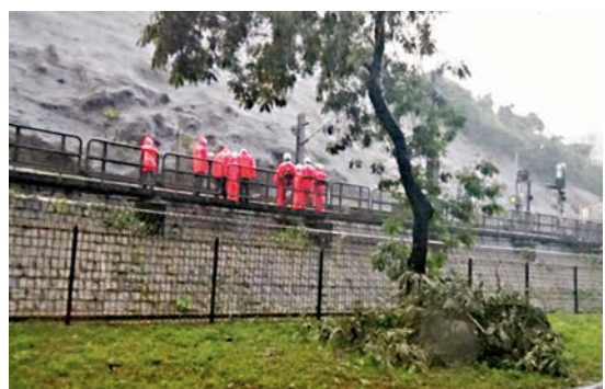
大學站附近塌樹壓毀電纜,港鐵派技工到場搶修。

天文台於昨日清晨6時10分發出8號西北烈風或暴風信號,至下午2時15分改發8號西南烈風或暴風信號。「海馬」其後在廣東汕尾海豐登陸,並減弱為強烈熱帶風暴及穩定地遠離本港,香港風勢逐步減弱,天文台在下午5時20分改掛3號強風信號,至夜後取消所有熱帶氣旋警告。