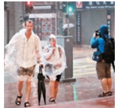
強颱風「海馬」為港帶來大雨,市民外出狼狽。