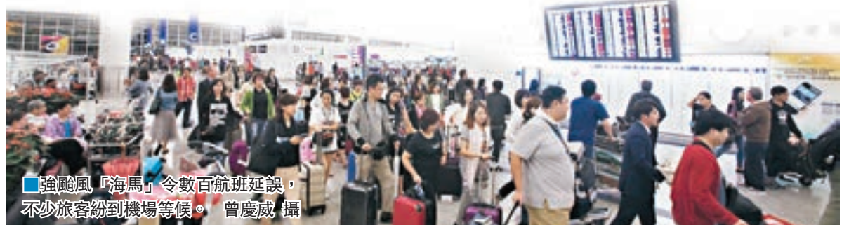
強颱風「海馬」令數百航班延誤,不少旅客紛紛到機場等候。

機管局表示,雖然熱帶風暴「海馬」逐漸遠離本港,但機場一帶範圍天氣仍然惡劣,航機仍然受到影響,呼籲乘客在出發機場前,預先查詢機管局網頁及航空公司網頁特別通告。機管局預料航班高峰期會於今日出現。