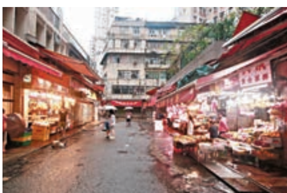
街市大多店舖昨日沒有營業,人流疏落。