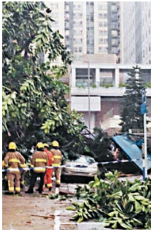
美孚月輪街塌樹壓車,消防員到場處理。