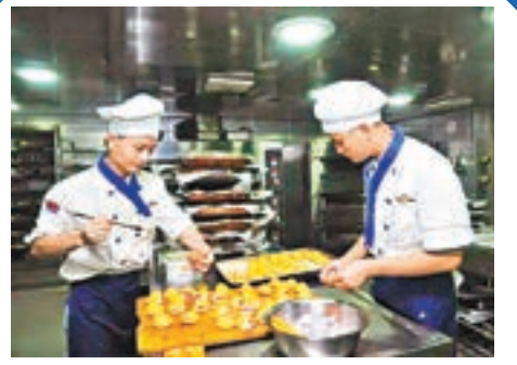
■麵點師在製作美食。 網上圖片