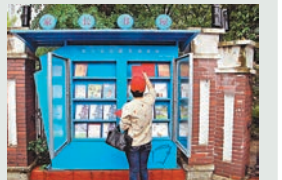
■「家長書屋」圖書陳列櫥窗。