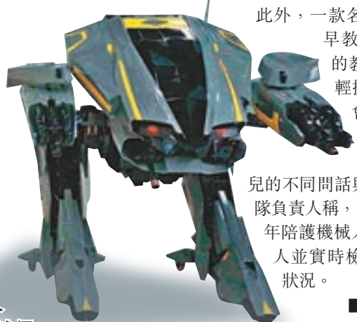
■巡邏機械人

此外，一款名為「星際酷寶」的早教機械人，結合配套的教材，只要使用者輕輕摸一下其頭部，它就會低頭識別並讀出相應卡片或書本中的內容，還能根據幼兒的不同問話與之互動。該項目團隊負責人稱，團隊還研發了一款老年陪護機械人，可以做到攙扶老人並實時檢測老人的身體健康狀況。