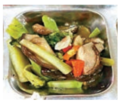
■「藍瘦香菇」料理 網上圖片