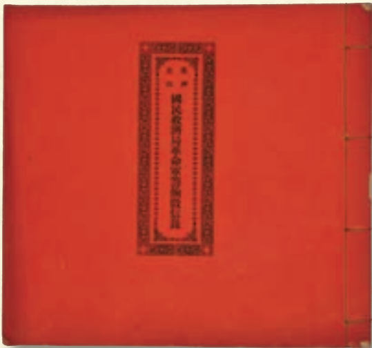
■(圖一)《美洲金山國民救濟局革命軍籌餉徵信錄》記錄了籌餉局的開支及收入；該局為辛亥革命期間的孫中山提供了行程旅費。(舊金山五洲致公總堂藏品)