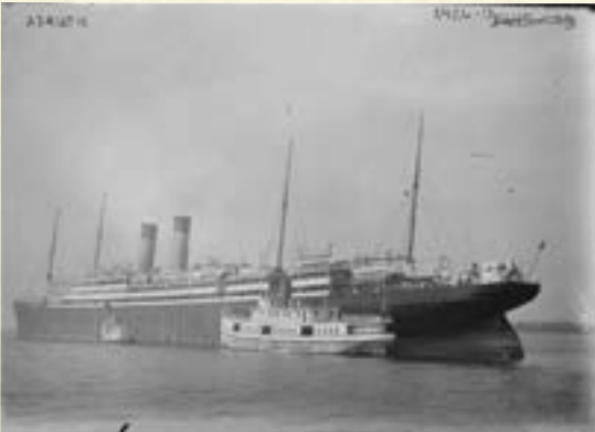
■(圖三)孫中山於1911年11月2日乘坐圖中的「亞德里亞海號」，從美國前往英國，至同月10日抵埗。