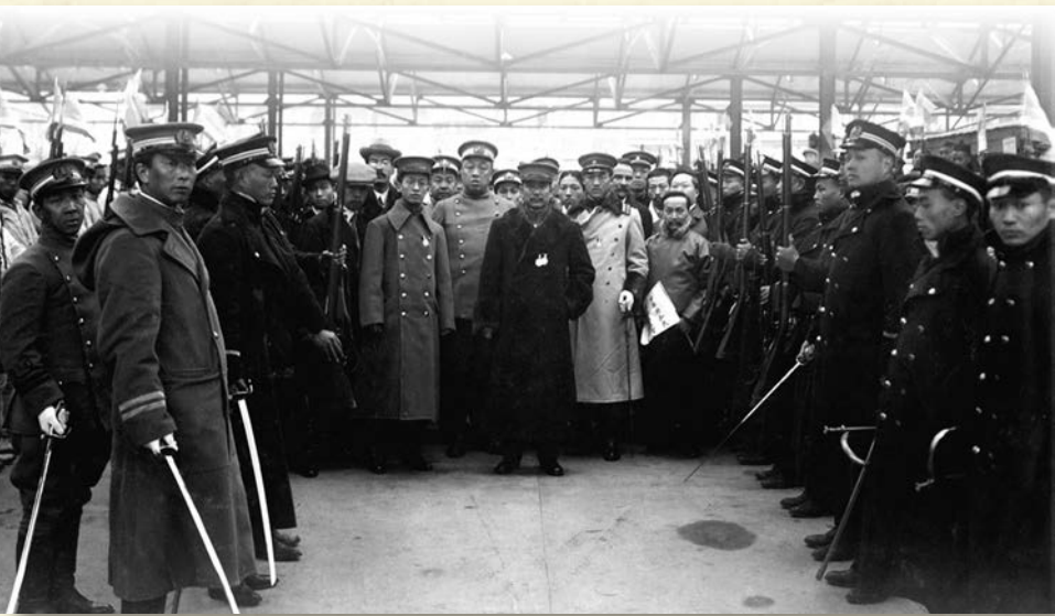
■(圖七)1912年1月1日上午10時，孫中山在上海北站準備乘坐滬寧鐵路的專列火車，前往南京就任臨時大總統。

辛亥革命爆發時孫中山正身處美國，為革命到美國各埠鎮宣傳和籌款。事緣孫中山於1911年7月結合美國舊金山致公總堂及美洲中國同盟會總會的力量，在三藩市成立了中華革命軍籌餉局，對外稱為「國民救濟局」(圖一)，辦事處設在三藩市新呂宋巷36號的致公總堂。籌款組織成立後，包括孫中山在內的四位籌款員分南北兩途，由西岸的三藩市前往東岸的紐約；孫中山偕黃芸蘇赴北路，在同年9月2日出發，10月10日抵達科羅拉多州的丹佛市，入住當地的布朗宮酒店(Brown Palace Hotel)321號房間(圖二)。翌日上午，孫中山得悉武昌起義成功的消息後，本可立即回國，以助革命軍一臂之力，然而他綜觀國際形勢，經過深思熟慮，決意爭取列強在外交和財政上支持，並防止列強向清廷靠攏。