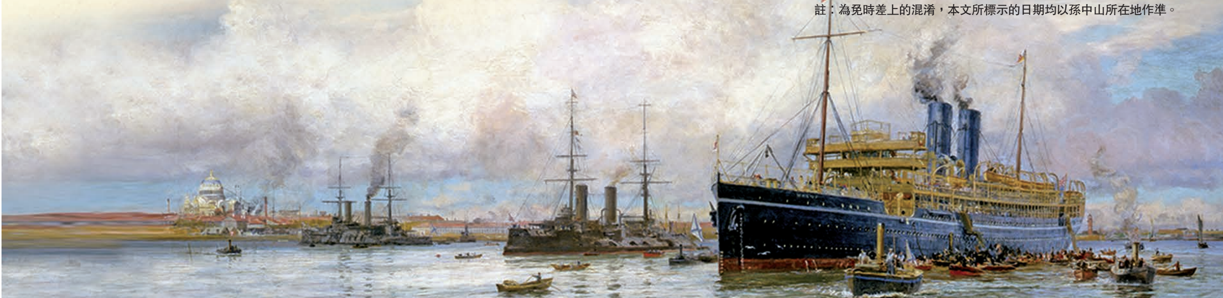
■(圖四)孫中山1911年11月24日在法國馬賽乘坐「馬瓦號」，至12月9日抵達斯里蘭卡(錫蘭)可倫坡。