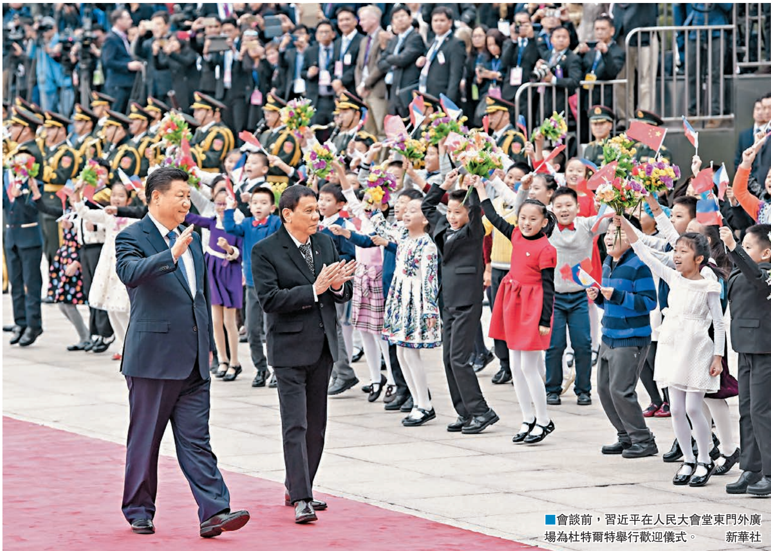
會談前，習近平在人民大會堂東門外廣場為杜特爾特舉行歡迎儀式。