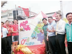
台灣自行車節開幕