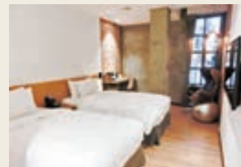
■房間用品設計懷舊