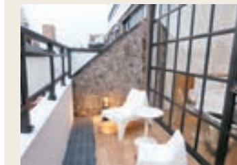
■八樓的房間有露台