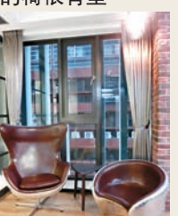
■以飛機外殼金屬做的椅很有型