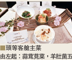
■頭等客艙主菜 由左起：蒜茸莧菜，羊肚菌五目飯，山西陳醋西班牙黑毛豬排；後排中間：紅燒魚柳