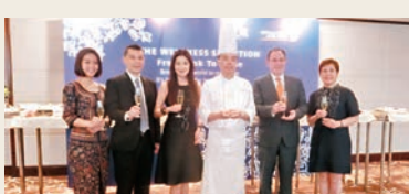
■新加坡航空夥拍香港康得思酒店明閣粵菜食府呈獻健康有營養香港佳餚。

新加坡航空公司(新航)推出超值香港來回新加坡二人同行機票限時優惠，每位由港幣$1,344起(已連稅項及其他附加費)。優惠機票適用於SQ891、SQ863、SQ861、SQ856、SQ866及SQ868航班。發售日期只限於2016年10月20日至22日。經Singapore Air新航流動應用程式或新航網頁更可提前三天即10月17日率先購買優惠機票。是次推廣適用於於本年12月1日至明年3月31日期間出發。出發日期長達四個月，正好趁是次機會前往新加坡嚐遍當地地道美食，如海南雞飯、叻沙、胡椒蟹等。