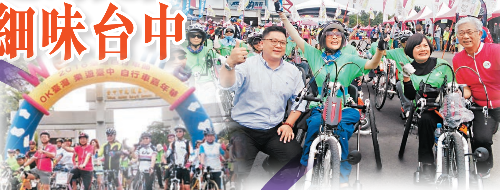
「2016台灣自行車節」起步禮。

台灣對觀光業一向很重視，台中市今年特別落力推動旅遊業，他們把握「台中是自行車的故鄉」、世界的自行車產業發展重心在台灣中部，力谷台中單車遊，將台中的自行車產業價值融入觀光活動，規劃台中、彰化、南投、苗栗各一條騎乘路線，再串聯起來，方便愛好自行車旅遊之騎士規劃多日中台灣低碳自行車遊，享受慢活旅遊，體驗台中之美。寓運動於旅遊是不少人的愛好，秋季更是特別適合。