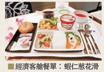
■經濟客艙餐單：蝦仁蔥花滑蛋；優選經濟客艙餐單：鮮人蔘菇粒蒸豬肉餅

頭等艙餐單有山西老醋西班牙黑毛豬，以及羊肚菌五目飯；商務艙餐單有黑松露醬鴨鴨胸蟲草花沙律，以及乾燒明蝦球；優選經濟艙有滋養的鮮人蔘菇粒蒸豬肉餅。