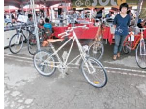
嘉年華有設計新穎單車