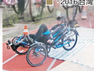
為傷健人士而設的手動單車

台灣自行車環島路網日趨完善，自行車環島風氣一直盛行，所以台灣「交通部觀光局」近年有辦「自行車節」，「2016台灣自行車節」於10月2日至11月13日登場，主軸活動有「OK台灣，樂遊台中自行車嘉年華」；「自行車登山挑戰」邀請國際知名選手同台競技挑戰合歡山；邀請不同類型的單車團體朋友以自行車串連接力環島的「騎遍福爾摩沙」，本年度更新增澎湖團；壓軸活動是於11月13日舉辦的「日月潭Come! Bikeday」。