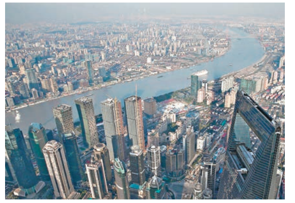
中國第三季經濟增長6.7%符合預期，有利中高收益債市。圖為上海市容鳥瞰。

他指出，部分中國一線城市對購房實施管制，在於擠出資產泡沫，非全面打房，預期若房價不致全面性大幅下挫，隨着中國市場進入金九銀十傳統旺