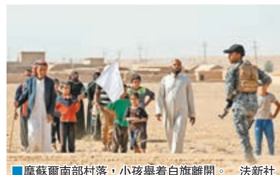
摩蘇爾南部村落，小孩舉着白旗離開。

但近幾日未見有大量民眾逃離，相信是ISIS阻止他們離開。據悉聯軍暫時也不建議摩蘇爾居民強行逃離，擔心他們若被抓到，可能會被處決。聯合國估計，開戰首周會有多達20萬人逃離摩蘇爾，最壞情況下更可能有多達100萬人。 美國官員又指，ISIS為死守摩蘇爾可能動用化武，美軍已定期收集炮彈碎片進行化驗，並首次透露在本月5日收集到的一個子彈碎片上，驗出芥子毒氣的物料，相信當時ISIS是向伊拉克保安部隊發射子彈。