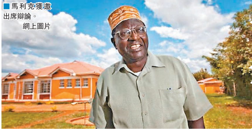
馬利克獲邀出席辯論。網上圖片