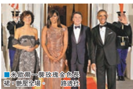
米歇爾一襲玫瑰金色長裙，艷麗全場。

今次是奧巴馬任內第13場國宴，也是最隆重一次，出席者不乏名人、國會議員、資深政府官員、白宮幕僚等等，記者人數也較往常更多。米歇爾在國宴期間感謝賓客「帶給她精彩的8年」，形容今次宴會非常成功。 上任總統布希兩屆任期內辦了11場國宴，雖然奧巴馬多辦兩場，但在近代美國史上仍算偏少。克林頓在兩任內辦了28場國宴，較前兩者加起來還多。 ■《每日電訊報》