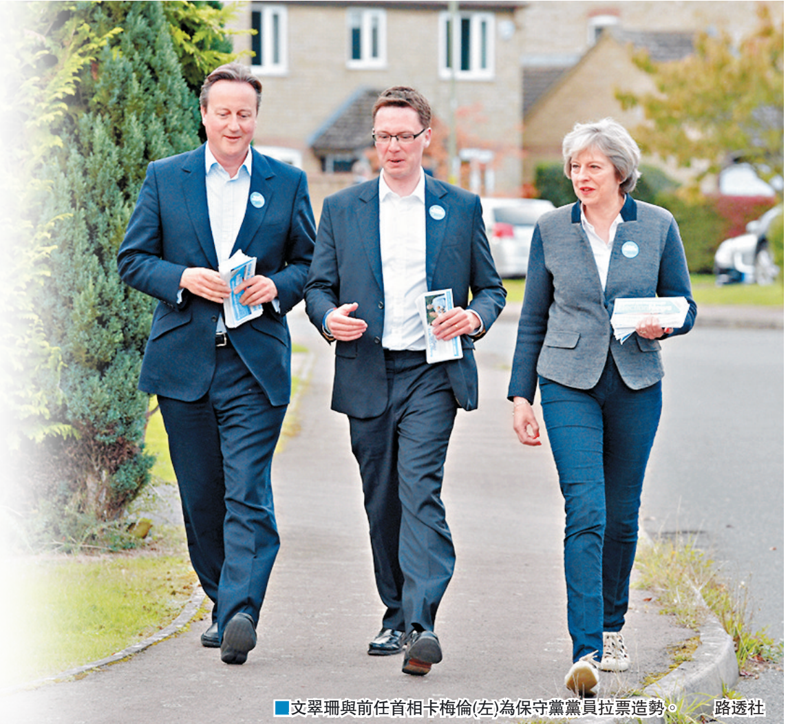
■文翠珊與前任首相卡梅倫(左)為保守黨黨員拉票造勢。