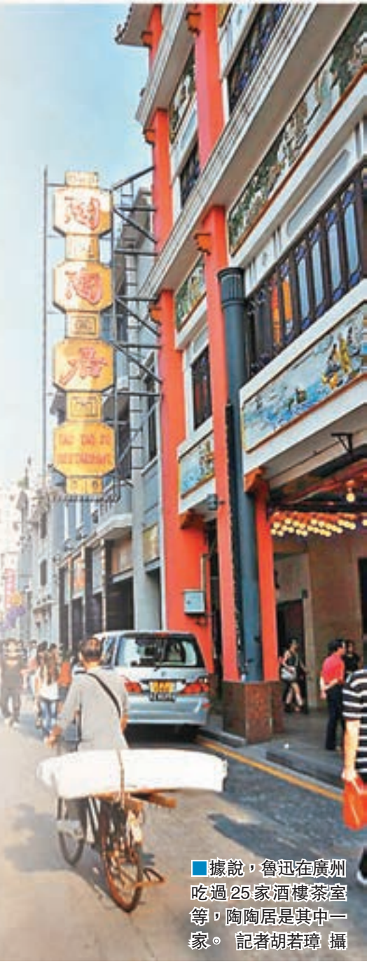
據悉,魯迅在廣州吃過25家酒樓茶室等,陶陶居是其中一家。