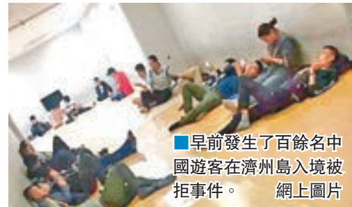
早前發生了百餘名中國遊客在濟州島入境被拒事件。網上圖片