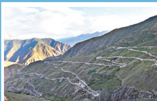
川藏公路上著名的「怒江72拐」。