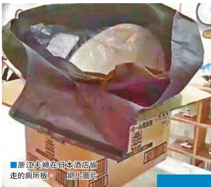
浙浙夫婦在日本酒店偷走的廁板。

香港文匯報訊(記者 俞畫 浙江報道)一導遊微信公眾號前晚發了一篇推文《驚了!寧波遊客在日本拿走酒店馬桶蓋,查證後酒店要求導遊寄回……》。該文章迅速在網絡發酵,閱讀量超過十萬,經記者查證,該遊客籍地為浙江台州,因為參加了位於寧波的浙江東港旅行社的日本團,所以被誤認為寧波遊客。據悉,目前遊客已將馬桶蓋寄回日本,並寫下道歉信。