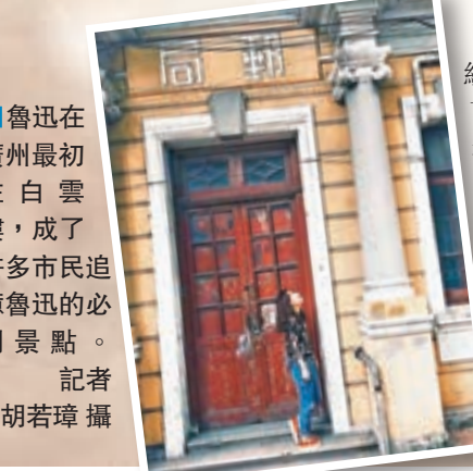
魯迅在廣州最初住白雲樓,成了許多市民追憶魯迅的必到景點。

此次,她特意空出一天走訪廣州的大街小巷,探訪當年魯迅與許廣平的廣州足跡。說起魯迅,陳某說,每次讀《兩地書》就會被魯迅的「吃货執念」笑開懷。她分享了一個她最喜歡的魯迅故事。內容是魯迅得了兩包柿霜糖,許廣平說「這糖可以治嘴角生瘡」,於是魯迅便把糖珍藏起來。到晚上,他又覺得「嘴角生瘡的時候不多,還不如趁現在新鮮吃一點」,於是又偷偷拿出來吃完了。