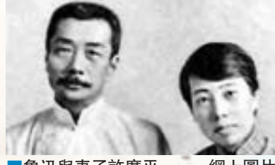
魯迅與妻子許廣平。

昨日是魯迅逝世80周年。除了朋友圈等社交平台,網友轉帖懷念魯迅外,不少文藝青年還根據魯迅與其第二任妻子許廣平的《兩地書》,探訪許廣平羊城故居白雲樓,以及書中兩人談及的茶樓酒肆,開啓了「跟着魯迅、許廣平吃廣州」的美食之旅。