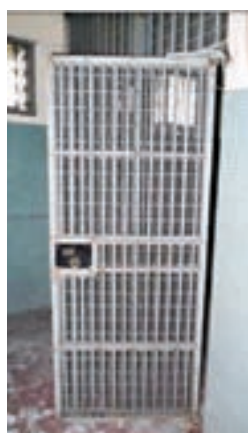
警署內部保留拘留室。