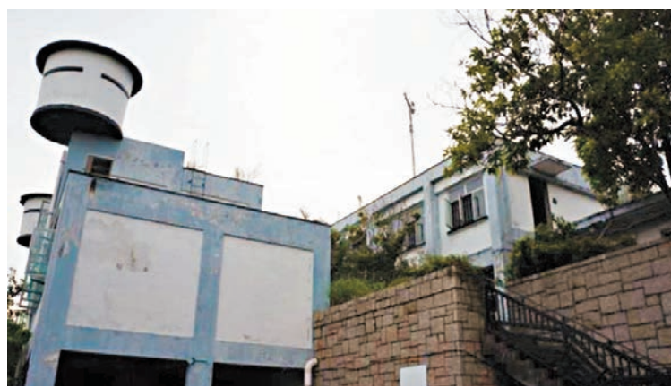
前流浮山警署已被古諮會評定為3級歷史建築。