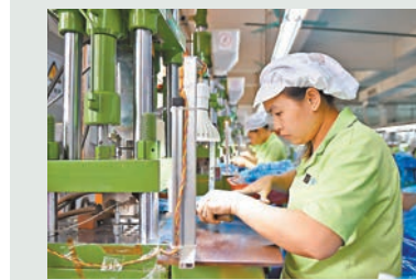
內地提前完成年初制定全年城鎮新增就業1,000萬人的目標。圖為廣西一家企業的工人在車間作業。

香港文匯報訊（記者 海巖 北京報道）在宏觀經濟企穩的同時，就業作為衡量經濟運行在合理區間的下限指標，好於預期。國家統計局昨日發佈數據顯示，首三季度內地城鎮新增就業1,067萬人，提前一個季度完成年初制定的全年1,000萬人的預定目標。