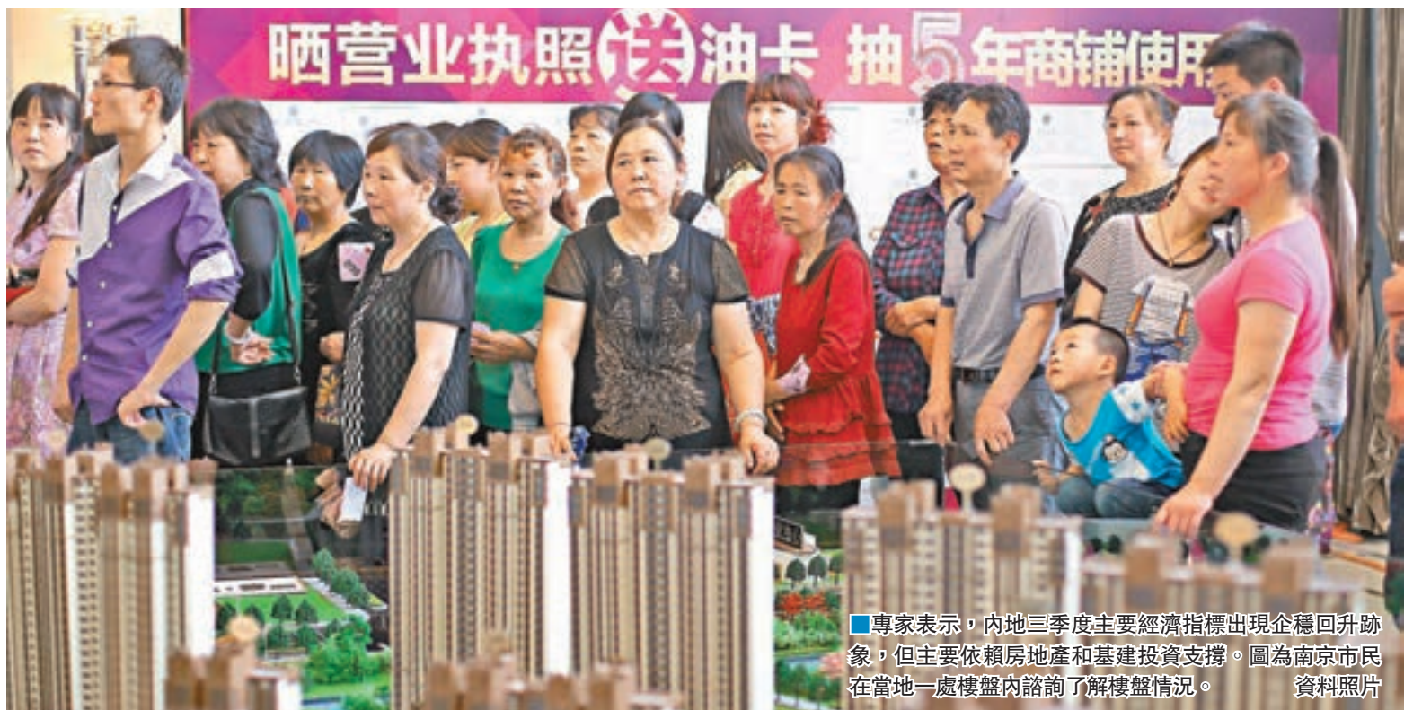
專家表示，內地三季度主要經濟指標出現企穩回升跡象，但主要依賴房地產和基建投資支撐。圖為南京市民在當地一處樓盤內諮詢了解樓盤情況。資料照片

香港文匯報訊（記者 海巖 北京報道）內地第三季度經濟「成績單」昨日出爐，第三季度國內生產總值（GDP）同比增長6.7%，連續三個季度持平，包括民間投資在內的固定資產投資累計增速扭轉了連續下滑態勢出現企穩回升，房地產開發投資同比增速也持續回升至5.8%，消費增速則創下年內新高。專家表示，三季度主要經濟指標均出現企穩回升跡象，但主要依賴房地產和基建投資支撐，隨着房地產調控加強，中國經濟明年將面臨更多挑戰。