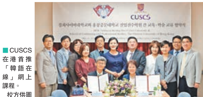
■CUSCS在港首推「韓語在線」網上課程。

香港文匯報訊（記者 高鈺）香港中文大學專業進修學院（CUSCS）今年與慶熙網絡大學合作，在本港推出首個混合式學習的「韓語在線」網上課程，結合網上學習與面授導修的模式，讓本港及海外有志進修韓語的人士修讀。CUSCS將於下月舉行兩場免費體驗工作坊，有興趣人士可登入cuscs.hk登記參加。