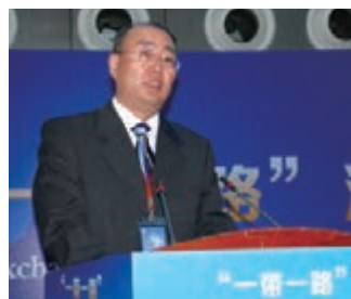
■陝西省文物局局長趙榮榮希望「一帶一路」沿線國家文化遺產保護事業實現合作共贏

陝西歷史博物館是西北地區唯一中央和地方共建的國家級博物館，肩負着整合陝西優秀的文物資源和對外文化交流的歷史重任。2015年9月23日，中共中央總書記、國家主席習近平在訪美時指出：「要看千年的中國去西安」，這充分表明西安在中華文明歷史長河中所具有的源頭價值，陝西歷史博物館不僅擔負着整理和保存中華文明歷史記憶的文化功能，而且肩負着將優秀的中華文化介紹到國外的傳播功能。近年來，陝西歷史博物館積極促進對外交流合作，已經和英國、美國、新西蘭、匈牙利等十幾家博物館建立友好關係，在合作中更加注重新聞與文化的深度融合，積極探索建立文化交流的長效機制。陝西歷史博物館黨委書記強躍介紹說，在國際交流合作中，陝歷博開拓國際視野，培養國際思維，積極主動地融入國際社會，通過多種手段詮釋藏品文化內涵，充分挖掘文物背後的故事。首先，在選擇文物時更加注重新聞的故事性和人文情懷，通過講好陝西文物故事，和故事本身的文化魅力找到合作的共鳴點。例如在展示唐長安城的國際性時，會通過胡人俑、貿易物品、錢幣等文物和文化元素來體現中華文明的開放性，同時，也積極開發帶有多元文化符號的文創產品。其次，更加重視與當地普通百姓的互動，讓普通百姓參與活動，更多的了解文物故事。此外，還利用互聯網等多平台與國外博物館進行網上交流，遠程分享互動。