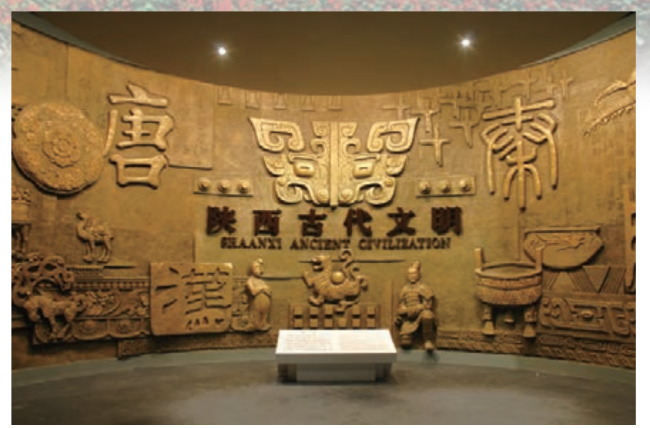
■《陝西古代文明》展覽