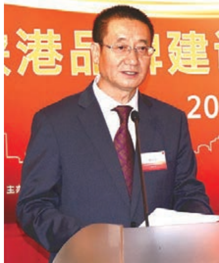
■ 陝西省政府副秘書長張小寧致辭

陝港品牌建設與質量合作交流會10月17日在港舉行，拉開了第六屆陝粵港澳經濟合作活動周的序幕。會上，陝西省質量技術監督局局長喬軍與香港品質保證局總裁林寶興簽署了《陝港品牌與質量合作備忘錄》。陝西省政府副秘書長張小寧、香港品質保證局主席盧偉國、陝西省貿促會會長薛華等出席會議。陝西省委宣傳部副部長李偉主持會議。