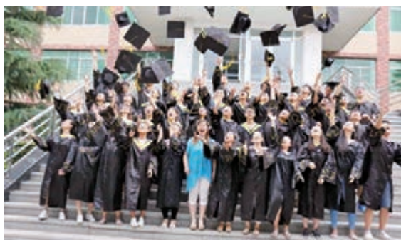
■ 西安教育實力雄厚，受到中亞學生青睞。

由西安交通大學發起成立的「新絲綢之路大學聯盟」，總部設在位於西安的中國西部科技創新港，一年多的時間，得到絲綢之路沿線大學的積極響應，目