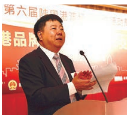
■ 陝西省委宣傳部副部長李偉主持會議