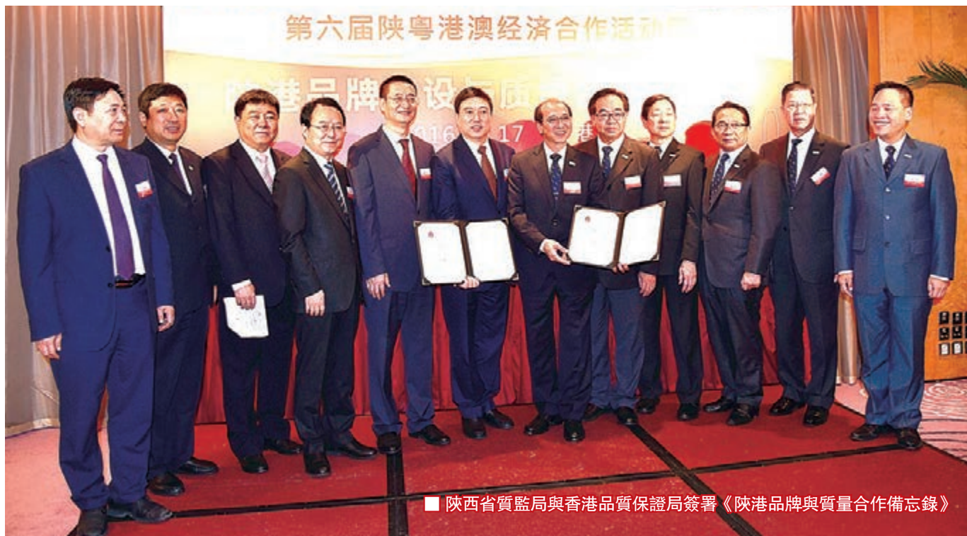
■ 陝西省質監局與香港品質保證局簽署《陝港品牌與質量合作備忘錄》

據介紹，此次簽署備忘錄，旨在將兩機構的專業優勢相結合，進一步擴大陝西省與香港地區在檢驗檢測認證服務方面的合作，提升兩地企業品牌建設水平，深化陝港合作，擴大對外開放，推進「一帶一路」建設。合作以「推進絲綢起點建設，深化產業項目合作」為主題，將按照「加強企業品牌建設，服務經濟轉型升級」的原則展開。