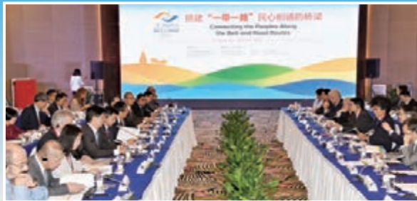
■ 「一帶一路」國際研討會在西安舉行。

「一帶一路」國際研討會9月26日在陝西西安成功舉行。在此次會議上，「一帶一路」建設三周年進展報告正式發佈。從報告中公佈的個像數據可以看出，三年來，中國與「一帶一路」沿線國家和地區的合作步伐不斷加快，為沿線國家和地區注入了新的增長動力，並開闢出共同發展的巨大空間，成果豐碩。