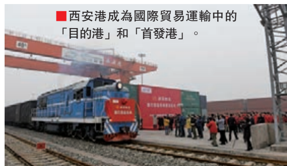
■ 西安港成為國際貿易運輸中的「目的港」和「首發港」。