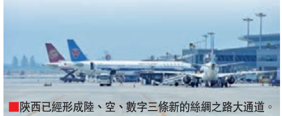
■ 陝西已經形成陸、空、數字三條新的絲綢之路大通道。

作為絲綢起點的陝西，三年來，「一帶一路」戰略已經深入陝西建設發展的各個領域，成為陝西發展的重要動力引擎。陝西通過建設綜合交通樞紐中心、國際商貿物流中心、科教文化旅遊中心、能源金融中心、經貿合作中心，有力推動了「一帶一路」的建設。