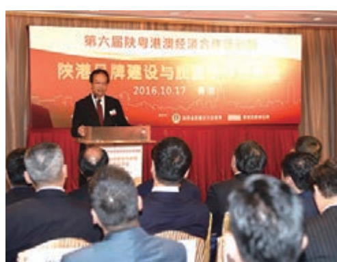
■ 陝港品牌建設與質量合作交流會現場