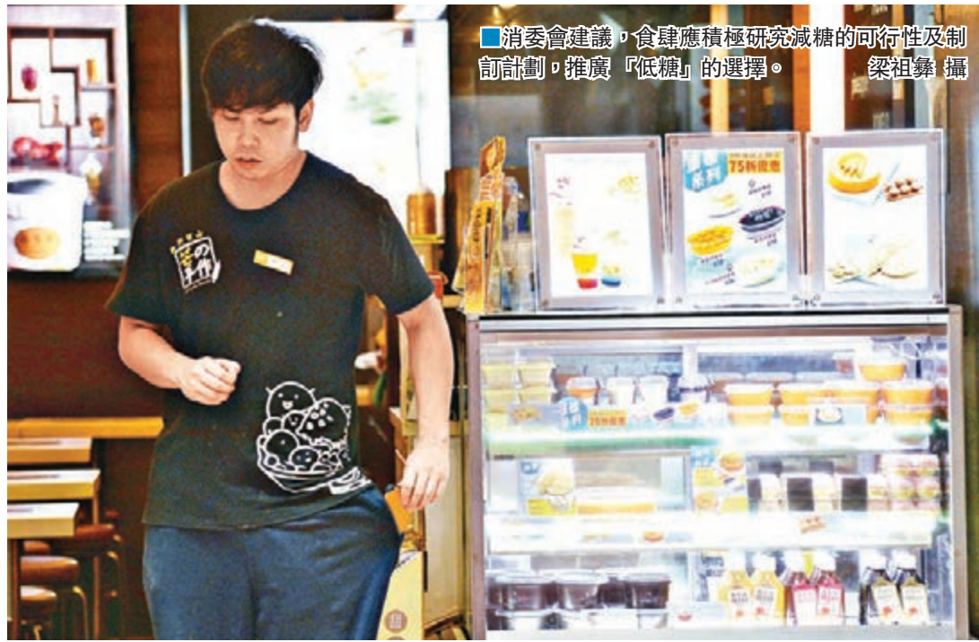
■消委會建議，食肆應積極研究減糖的可行性及制訂計劃，推廣「低糖」的選擇。