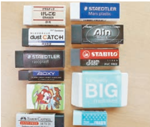
■消委會研究發現，25款樣本中，只有1款完全沒有檢出塑化劑。

香港文匯報訊（記者 鄭慧敏）擦膠是學童的必需品，消委會測試市面25款擦膠樣本，並參考台灣標準檢測8種鄰苯二甲酸酯類塑化劑的含量，發現其中24款樣本均有塑化劑，當中14款樣本的塑化劑含量超標30%至60%，遠高於台灣標準的上限（0.1%）。消委會表示，正常使用擦膠一般不會構成即時健康威脅，但如果兒童有舔