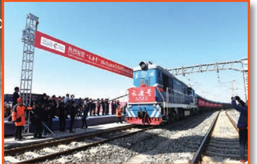
■2016年3月26日上午，裝載着2000噸哈薩克斯坦油脂的首趟「長安號」國際貨運回程班列緩緩駛進西安港