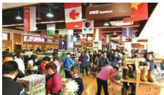
■「Ulife 西安港進口商品直營店」掀國慶購物狂潮