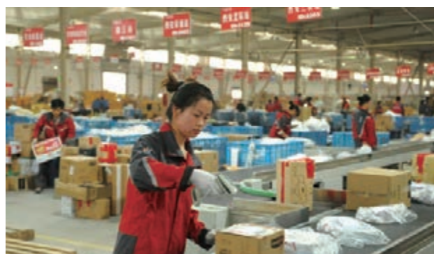
■知名電商企業紛紛入駐，圖為京東商城物流分揀流水線