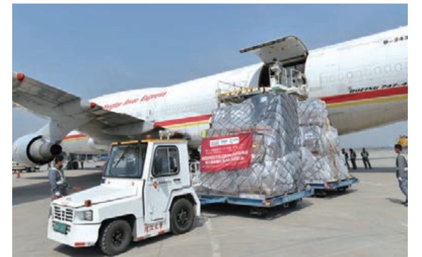
■全國首條陸空聯運跨境電商貨運直飛航線貨物卸貨

此外，西安國際港務區在高標準做好園區基礎設施配套建設的同時，2021年大運會場館、環球醫療中心、西工大附中、足球運動公園、陸港紀念公園等一批民生大項目也已全面啟動建設，將使西安國際港務區成為宜居、宜商、宜創業的生態化、現代化、國際化新城。