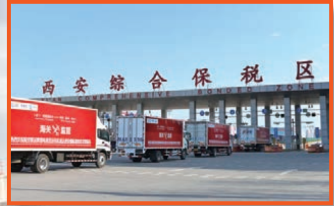
■西安綜合保稅區的運營已為自貿區建設積累了豐富的經驗

西安國際港務區，是陝西自貿區的核心板塊，在西安綜合保稅區、西安港、長安號、跨境電子商務、金融租賃等建設和發展過程中不斷探索創新，已做足了自貿區預習和實踐的功課，湧現出了投資發展的空前商機。