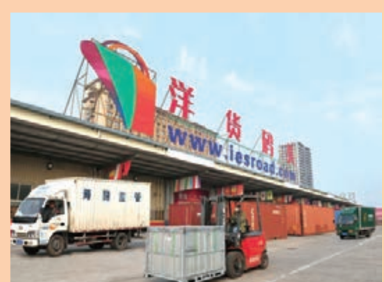
■西安跨境電商平台——洋貨碼頭

2個港口，建立起全面深入的戰略聯盟與業務合作關係。二是力爭2017年內開通西安直飛歐洲的常態化貨運包機，在國外打造跨境電商進出口貨物快速集散中心，豐富西安港多式聯運通道。三是針對企業需求，開闢並加密新的公路、鐵路運輸通道，實現與主要海港班輪航線及遠洋航線的定向對接。四是配合陝西省口岸辦、西安海關、陝西檢驗檢疫局依托陝西省電子口岸，搭建一體化電子通關平台和信息服務體系。五是與各港口口岸對接，建設集裝箱服務中心，實現海運服務內陸實時定制，提供海運箱還箱、修箱、堆存服務。六是建設西安港與空港間的快速貨運聯絡線，實現陸港空港密切聯動。