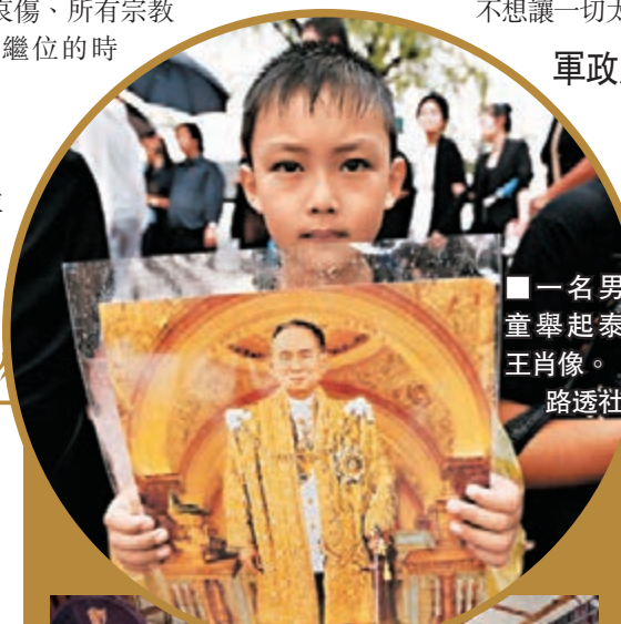
■一名男童舉起泰王肖像。