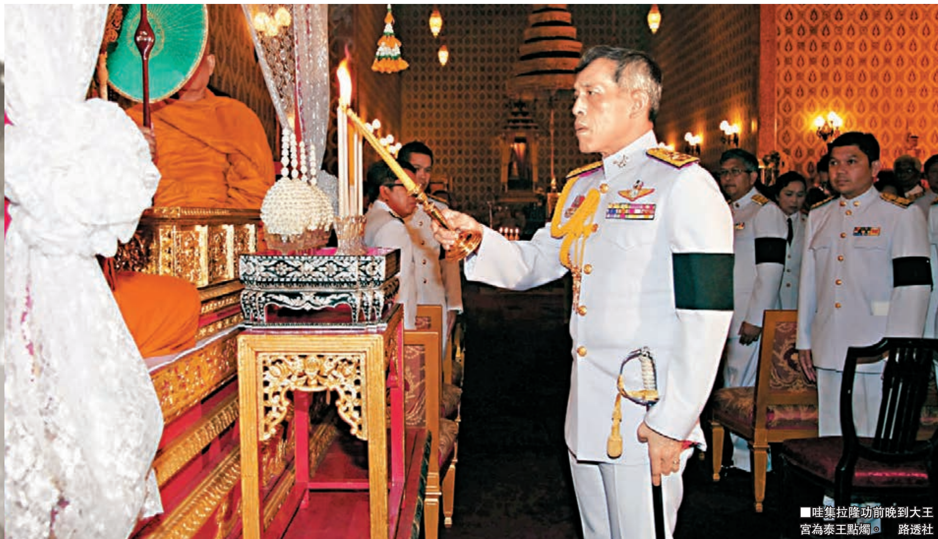
■哇集拉隆功前晚到大王宮為泰王點燭。