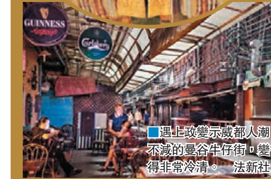
■遇上政變示威都人潮不減的曼谷牛仔街，變得非常冷清。