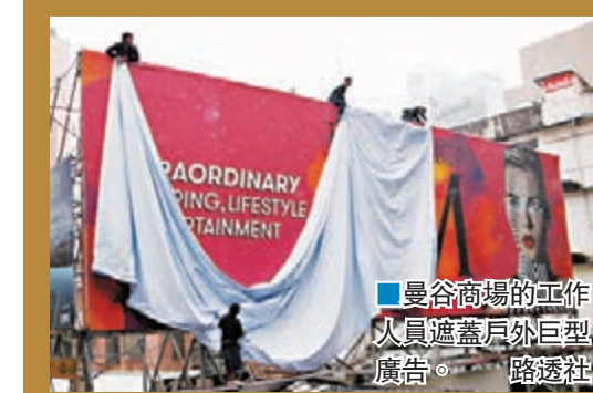
■曼谷商場的工作人員遮蓋戶外巨型廣告。