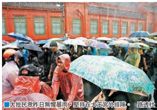
■大批民眾昨日無懼暴雨，堅持在大王宮外排隊。

泰王普密蓬駕崩後，全球目光落在王儲哇集拉隆功身上，不過他意外宣佈延遲繼位，令外界擔心可能引起泰國政局不穩。哇集拉隆功前晚召見總理巴育及攝政王傳話派定心丸，呼籲國民不必擔心他延後繼位的決定。巴育又透露，哇集拉隆功屬意在普密蓬喪禮及火化儀式完結後正式繼位，意味最快相信也要一年後才成事。