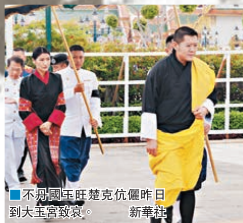
■不丹國王旺楚克伉儷昨日到大王宮致哀。