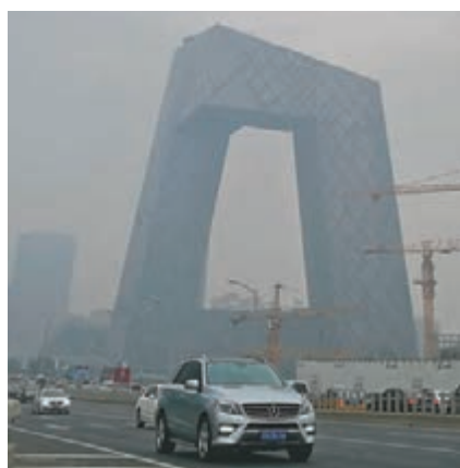
北京霧霾持續，污染加重。

同時，外地進京車輛污染問題突出。外地進京車輛達到每天30萬輛左右，其中重型車佔到三分之一