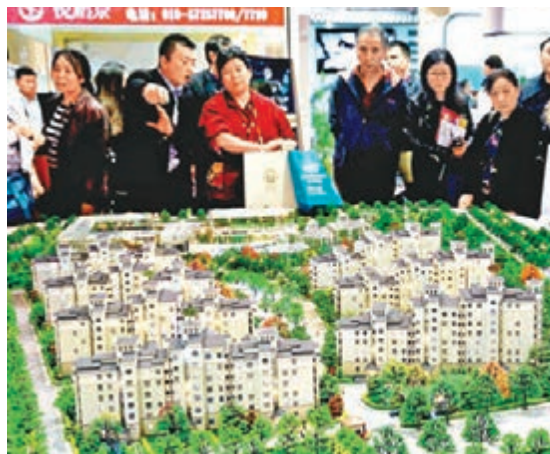
北京新房交易量下滑。圖為參觀者在了解樓盤的情況。

據該機構提供的數據顯示，國慶後的8天時間裡，北京日均網籤量為170套，較9月日均248套下