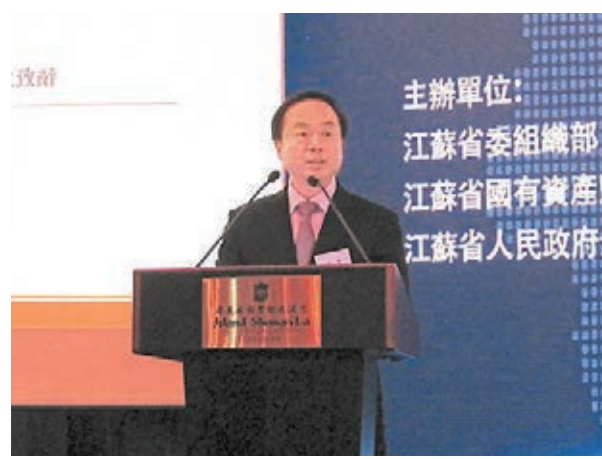
王奇承諾會讓香港人才在當地有用武之地，無後顧之憂。