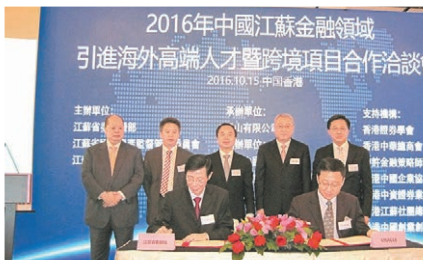
江蘇省農聯社和甲骨文公司在會上簽訂了戰略合作備忘錄。

香港文匯報訊(記者涂若奔)江蘇省政府昨日在本港舉辦「2016年中國江蘇金融領域引進海外高端人才暨跨境項目合作洽談會」，該省農聯社和甲骨文公司在會上簽訂了戰略合作備忘錄。省政府秘書長王奇表示，此次該省帶來了20多個合作項目，希望江蘇和香港以人才為紐帶，全方位開展科研、技術、項目和投資等方面的合作。他又稱，希望吸引更多香港金融業人才到當地發展，承諾會讓人才能在當地「有用武之地，無後顧之憂」。歡迎廣大港商到該省「走一走，看一看」，體驗該省創新創業的良好氛圍。