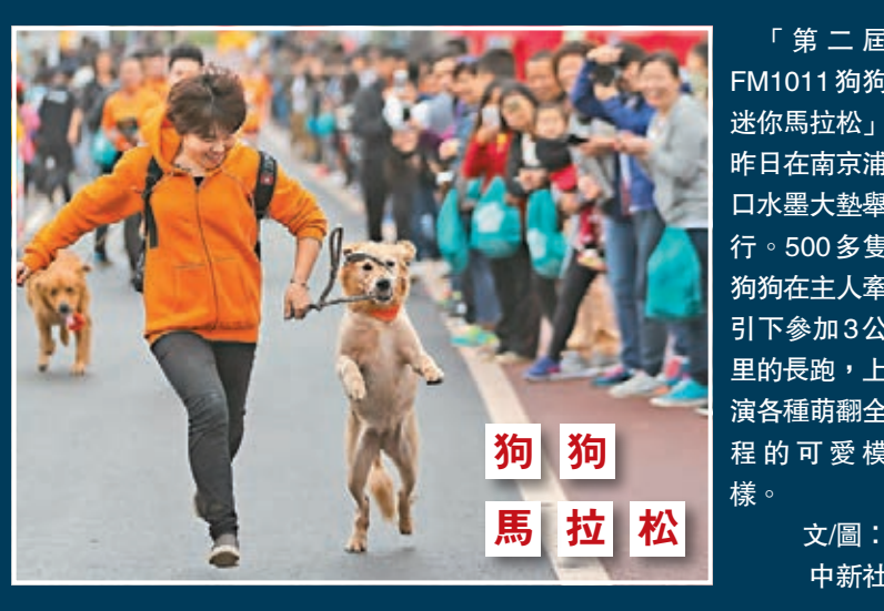
「第二屆FM1011狗狗迷你馬拉松」昨日在南京浦口水墨大壩舉行。500多隻狗狗在主人牽引下參加3公里的長跑，上演各種萌翻全程的可愛模樣。