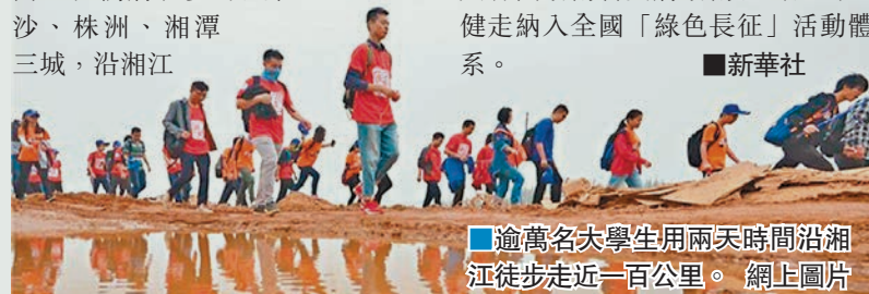
逾萬名大學生用兩天時間沿湘江徒步走近一百公里。網上圖片

公里活動的一萬多名大學生從長沙洋湖濕地公園出發。在兩天時間內，他們將徒步穿越長沙、株洲、湘潭三城，沿湘江