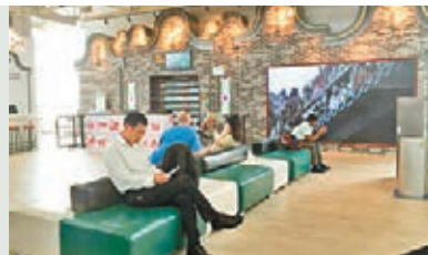
廣州白雲機場某登機口儼如「絲路驛站」。

為迎接第120屆廣交會，廣州白雲機場近日推出了一系列服務新舉措。從機場出發的國際和港澳台旅客驚喜地發現，A102登機口悄然「大變臉」——被譽為嶺南之門的「西關趟櫓」、代表嶺南傳統建築的「鍋耳牆」……讓A102國際登機口別有洞天、散發着濃郁的嶺南風情，吸引不少旅客駐足。