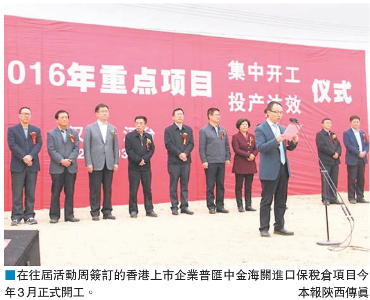
在往屆活動周簽訂的香港上市企業普匯中金海關進口保税倉項目今年3月正式開工。本報陝西傳真

香港文匯報訊(記者李陽波 西安報道)陝西省副省長王莉霞今日(16日)將率團抵港，開啟為期6天的第六屆陝粵港澳經濟合作活動周。在港期間，陝西省將舉行3場招商活動，重點推介金融和旅遊產業。同時，陝西省質監局還將與香港品質保證局簽訂《陝港品牌建設與檢驗檢測認證合作備忘錄》。