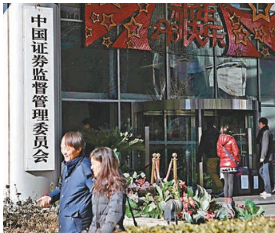
中證監發佈《證券基金經營機構參與內地與香港股票市場交易互聯互通指引》。資料圖片

易復原,法律規範層面仍待進一步完善。根據國務院印發的《法治政府建設實施綱要(2015-2020年)》,中證監制定了相關實施意見。意見的總體原則是堅持法治化、全面化的改革方向,依法、全面、從嚴監管。目標是到2020年建成基礎制度扎實、規則體系完善的證券期貨監管法律制度,培養並造就一支高質量且專業的監管執法隊伍。