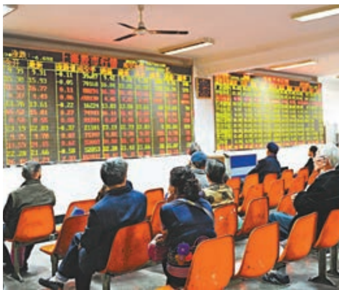
滬綜指昨收漲0.08%,報3,063點。

盤面上,周五中字頭股票漲幅居前,中化國際漲9%、中鐵及中交建漲4%。聯通股價本周狂飆近25%,其早前發佈公告稱,聯通集團被列入混合所有制改革第一批試點事項,但目前尚未得到最終批准,具體實施方案尚在討論之中。此外,互聯網、民航機場、工程建設等分類亦升幅居前,園林工程、多元金融、網紅直播等股類