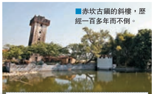
■赤坎古鎮的斜樓，歷經一百多年而不倒。

沿江而下，最關鍵的目標是尋找古鎮附近散落的眾多碉樓。自力村是碉樓保存最多也最完好的，姜文的《讓子彈飛》便在那裡取景，絕對不可錯過。百合村的聯登樓獨立聳立在村頭，十分顯眼，途經的百合鐵橋，也是用德國進口鋼材打造的百年老橋。另一座名為斜樓的古建築，堪稱碉樓界的「比薩斜塔」，這也是開平碉樓的一大亮點，據說是因為地基不斷下沉而造成的傾斜，但竟歷經一百多年而屹立不倒。還有三門里村的迎龍樓，其方形的建築形體沒有受到外來因素的影響，是開平碉樓傳統最原始的模式。