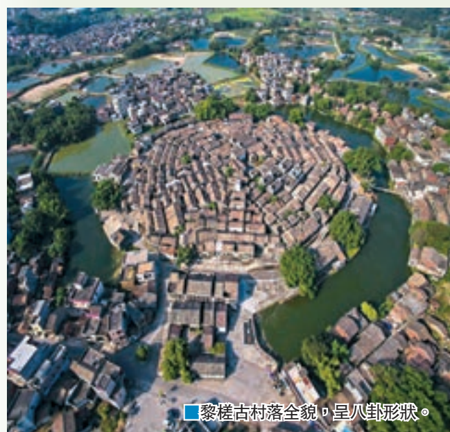
■黎槎古村落全貌，呈八卦形狀。