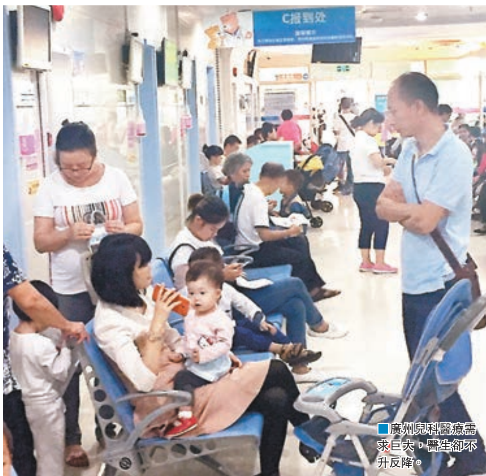
廣州兒科醫療需求巨大，醫生卻不升反降。

目前，兒科醫生緊缺已引起決策部門注意。近日，廣東省衛計委透露，已起草相關方案，提高兒科醫務人員薪酬待遇，一些相關保障措施也將同步推出。