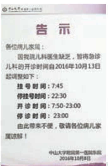
醫院貼出通知，暫停部分時段兒科急診服務。