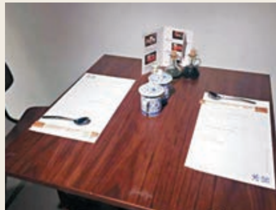
■ 即將開放為遊客服務

姆洛夫城堡內一家餐廳的啟發，我們將冰窖區域作為故宮西部區域的觀眾服務區開放，在充分尊重古建築現存狀況的前提下，結合冰窖的建築特色進行完全可逆的環境改造提升，讓觀眾在休息和享受優質服務的同時，對古代宮廷的避暑方法和冰窖所承載的文化內涵有所了解。整個區域預計可以同時容納觀眾近300名，冰窖之外牆下還設有一條露天長廊，提供了更多休息空間。」故宮博物院院長單霽翔表示。