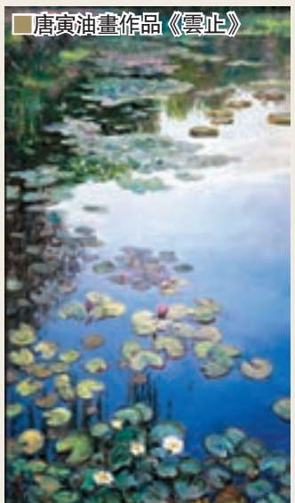
■ 唐寅油畫作品《雲止》