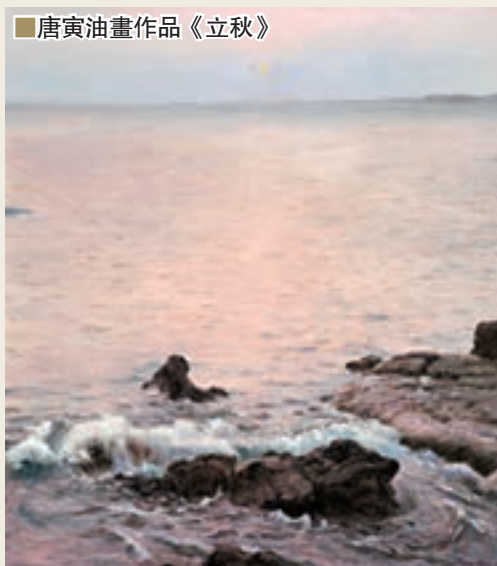
■ 唐寅油畫作品《立秋》