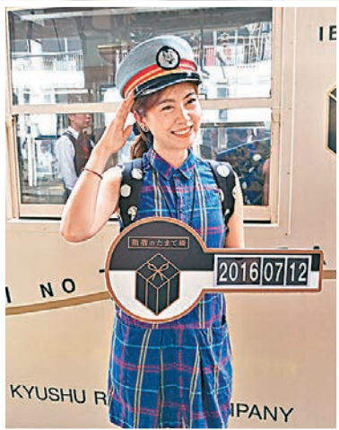
■遊客可以扮演車長