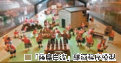
■「薩摩白波」釀酒程序模型