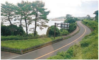
■在車窗外望，遠眺廣闊大海。

對從未試過在日本坐觀光列車的筆者來說，在鹿兒島，就可以一嘗坐上「指宿之玉手箱」至指宿，以及於熊本乘「A列車」至三角，兩款列車各具特色。