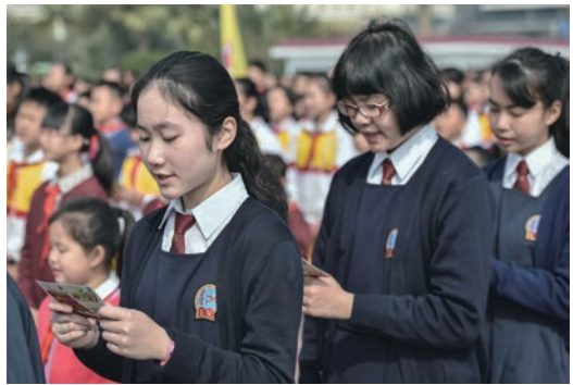
粵港澳青少年代表共同參加在珠海舉行的「開學第一課」愛國主題教育活動。