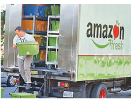
有分析指，亞馬遜進軍雜貨市場勢必威脅沃爾瑪等傳統零售商。網上圖片