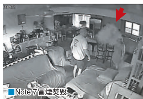
Note 7 冒煙焚毀

受 Galaxy Note 7 連續起火爆炸事故影響，三星昨日發出盈利警告，預測第三季營運收入只有5.2萬億韓圓(約359億港元)，較上周預測的7.8萬億韓圓(約538億港元)大減1/3；第三季銷售額也由早前預測的49萬億韓圓(約3,382億港元)，下調至47萬億韓圓(約3,244億港元)，下降幅度達到4%。三星股價跌勢未止，昨日早段一度急跌3.5%，收市仍跌0.65%。