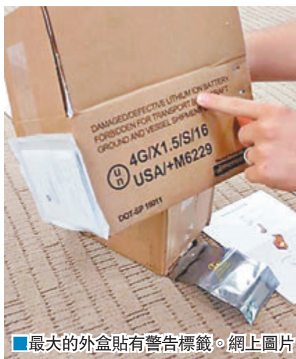
最大的外盒貼有警告標籤。