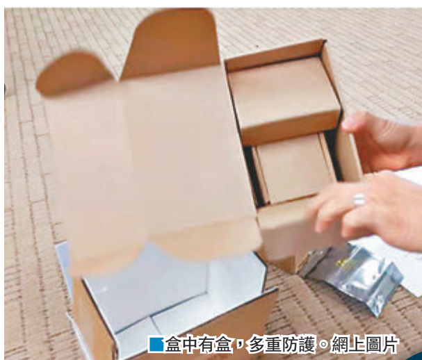
盒中有盒，多重防護。