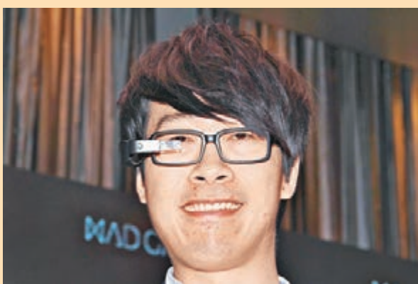
■若佩戴合適、角度準確的話，只要用家望向MAD Gaze的透明玻璃片就可以看到投射的內容。

訪問當日，正好是MAD Gaze的產品發佈會，會場上放有多部「工程機」予嘉賓體驗，試用環節大受歡迎。記者當然也不執輸，排隊一試。由於記者有二百多度近視，當日戴上眼鏡前往試玩，可能是為了節省時間，工作人員未有為記者將MAD Gaze安置上記者的眼鏡，建議記者用手拿著MAD Gaze慢慢調節角度。