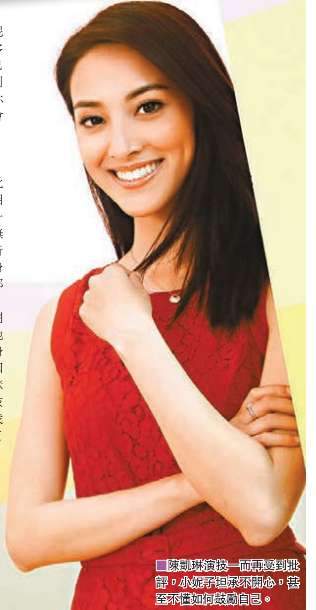
陳凱琳演技一而再受到批評，小妮子坦承不開心，甚至不懂如何鼓勵自己。