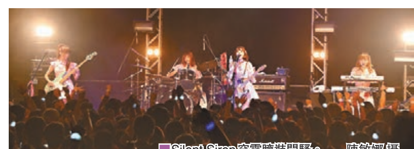
Silent Siren穿露臍裝開騷。

其間，她們開放讓粉絲發問，有數名男粉絲表示從日本飛來支持，令她們非常驚訝。她們希望下次在更大的場地開港騷，還叫粉絲各帶10位朋友入場，又笑稱大家各帶100位朋友來，她們就可以在東京巨蛋開騷。到演唱會尾段，吉田心情high，一時自稱「我哋係日本人」，又問粉絲「香港food有咩好介紹？」之後，唱到《DanceMusiQ》時，黑坂化身DJ打碟，還播出熱爆洗腦歌《PPAP》，隊友們則戴上發光眼鏡熱舞，氣氛高漲。安哥時，她們見粉絲準備了手幅和簽名橫額，感動到拍照留念。謝幕時，吉田搞笑地扮扔結他。她們高呼「我愛香港」，表示會盡快再來港開騷後，才不捨地離去。