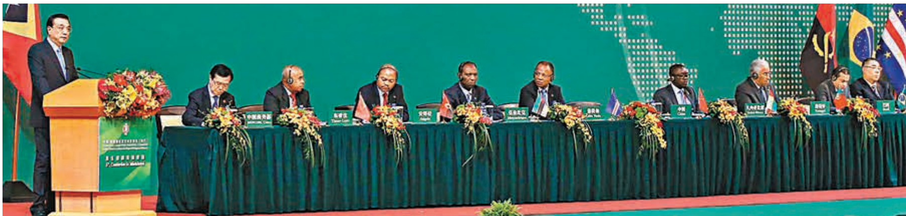
李克強出席中國—葡語國家經貿合作論壇第五屆部長級會議開幕式並發表主旨演講。

李克強還談到，中國過去發展取得的巨大發展成就，得益於改革開放。中國將堅定不移奉行互利共贏的開放戰略，對外開放的大門會越開越大。今天（11日）我們在這舉行中葡論壇，本身也表明中國的開放對各類經濟體的開放大門會越開越大。