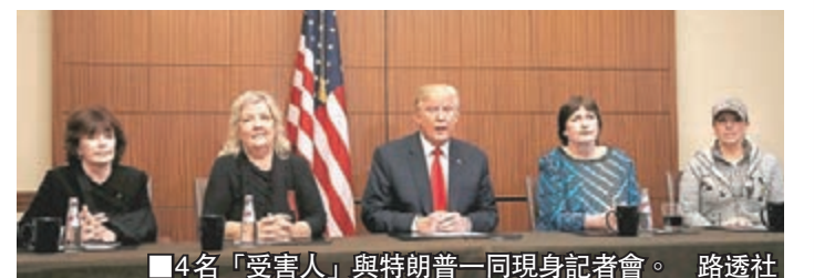
4名「受害人」與特朗普一同現身記者會。