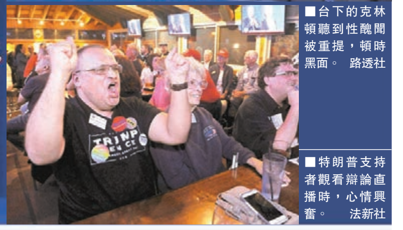
特朗普支持者觀看辯論直播時，心情興奮。