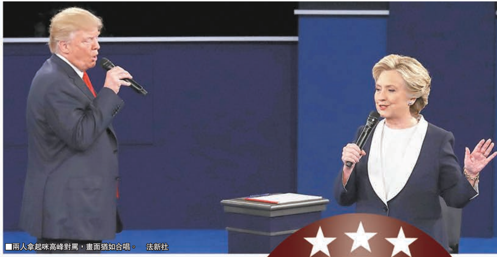
兩人拿起咪高峰對罵，畫面猶如合唱。