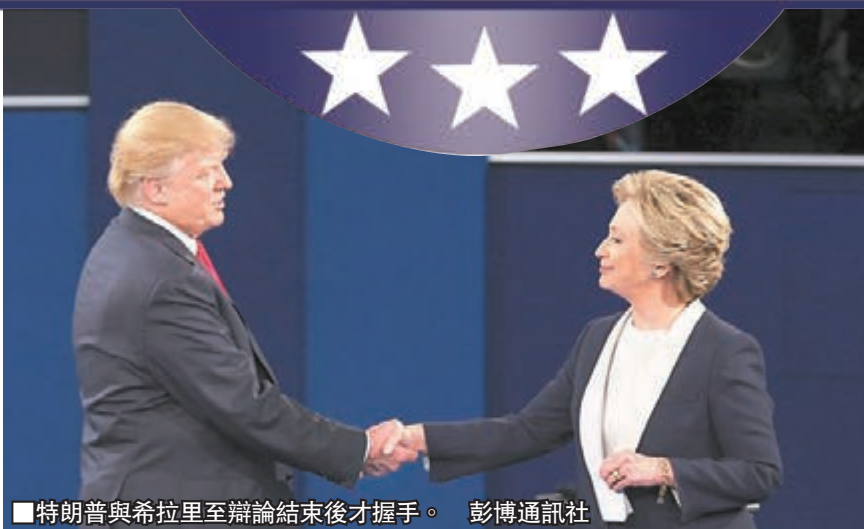
特朗普與希拉里至辯論結束後才握手。