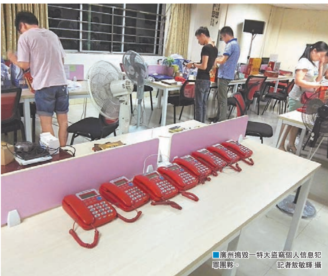
廣州搗毀一特大盜竊個人信息犯罪團夥。

香港文匯報訊(記者 敖敏輝 廣州報道) 侵犯公民個人隱私犯罪日益泛濫，廣東警方首次對其源頭進行專項打擊。廣東省公安廳近日指揮廣州、深圳、珠海等21市警方，成功搗毀34個重大盜賣公民個人信息犯罪團夥，450名疑犯落網，並繳獲被盜個人資料2.3億條。警方透露，疑犯既有來自銀行、機關單位、快遞公司、電商平台的「內鬼」員工，也包括網絡黑客等專業人員。他們通過便利條件大肆竊取公民信息，涉案金額巨大。