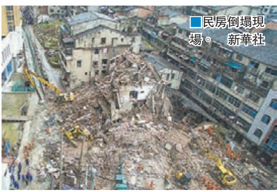
民房倒塌現場。

記者現場看到，廢墟兩側的民房建築牆體已受到不同程度破損。大型設備正對倒塌民房的相連房屋進行擴拆，現場持續傳來轟鳴聲。據現場人員介紹，倒塌民房為農民自建房，與其相連的還有5間建於20世紀70年代的農民自建房，目前這排房屋主體結構均受到不同程度破壞，隨時可能發生次生災害，給救援帶來安全威脅。