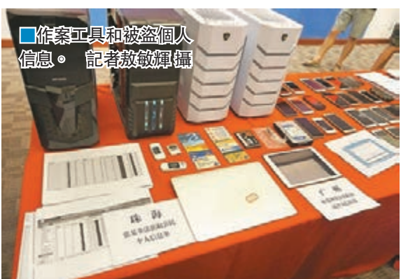
作案工具和被盜個人信息。