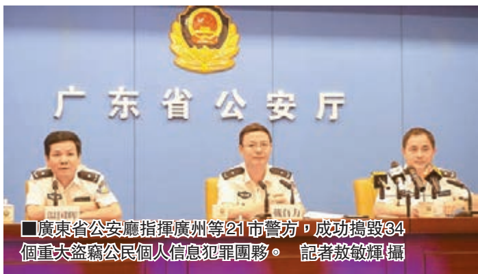
廣東省公安廳指揮廣州等21市警方，成功搗毀34個重大盜竊公民個人信息犯罪團夥。

記者了解到，今年以來，針對不同人群的精準電信詐騙犯罪日趨泛濫，引起警方的注意。廣東是這類犯罪的高發區，為此，廣東省公安廳部署全省警力，對其上游盜取公民個人信息犯罪進行線索梳理和偵查。