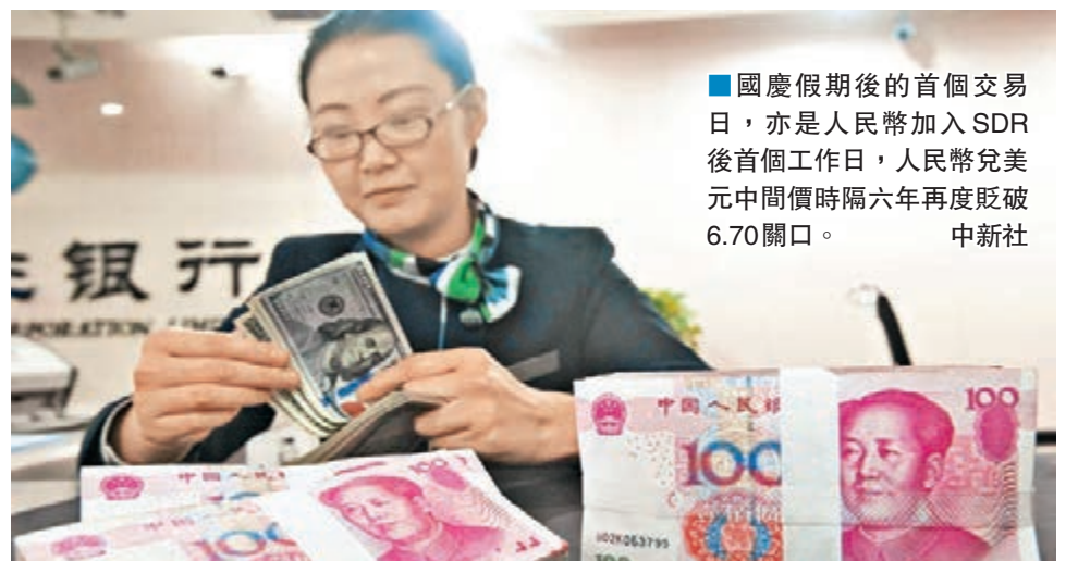
國慶假期後的首個交易日，亦是人民幣加入SDR後首個工作日，人民幣兌美元中間價時隔六年再度貶破6.70關口。

昨日官方公佈的人民幣兌美元中間價報6.7008，較上一交易日日跌230基點，創2010年9月末以來最低位。即期人民幣在岸價CNY原本走強，昨日上午九時曾見6.668的高位，但在人行公佈中間價後，在岸CNY瞬間狂跌300餘點，與中間價同創逾六年新低。離岸CNH的走勢亦類似，在上午九時跌近兩百點，午後跌勢一度收窄，但晚上六時後又反覆下行。截至昨晚九時，CNY和CNH分別報6.6071和6.7141，貶值幅度都超過100點。