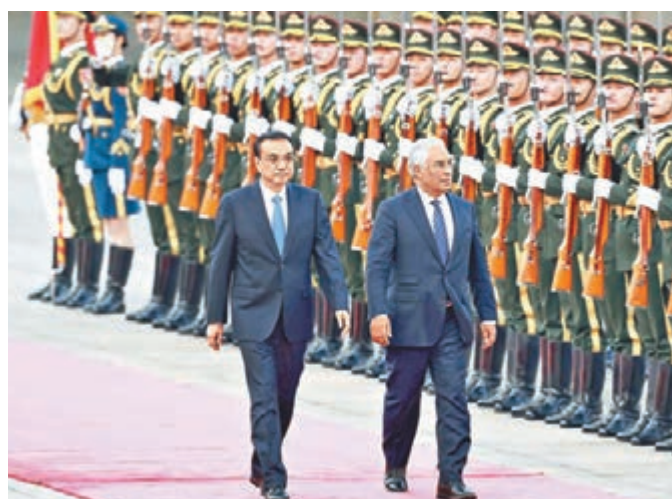
李克強在北京人民大會堂東門外廣場舉行儀式,歡迎來華訪問的葡萄牙總理科斯塔。

李克強強調,中方始終從戰略高度和長遠角度看待歐盟,支持歐洲一體化進程,認為一個團結、繁榮、穩定的歐盟符合各方利益,有利於促進世界經濟復甦與增長,維護國際金融市場穩定,希望葡萄牙作為歐盟重要成員,繼續為促進中歐關係發展發揮建設性作用。