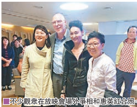
■不少觀眾在放映會場外爭相和惠英紅合照。