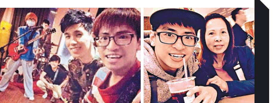
■廖文強與林奕匡在港台兩地合作開唱。