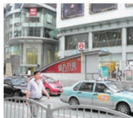
城市軌道建設PPP項目以其巨規模與空間,吸引眾多房企「跨界」,圖為上海一地鐵站。

香港文匯報訊(記者 章蘿蘭 上海報道)綠地控股透露,其與上海隧道工程公司組成的聯合體,已成功中標南京地鐵5號線工程PPP項目。南京地鐵5號線起點位於江寧區的吉印大道站,終點位於鼓樓