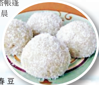
■陽春豆糠糍