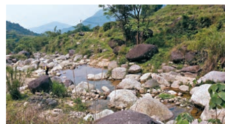
■陽春雞籠頂被「驢友」譽為最具誘惑山峰。

更有意思的是，在雞籠頂主峰有兩個界碑，一個是陽春與信宜的43號界碑，另一個是陽春、高州、信宜三市的三角型「O」號界碑，上面標有「粵府一九九