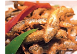
炸生坑魚 網上圖片