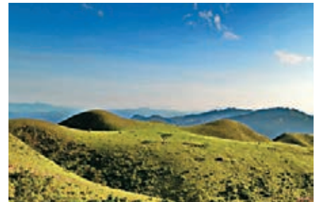
■陽春雞籠頂因擁有縮小版的呼倫貝爾大草原而廣為傳頌。