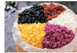
五色糯米飯