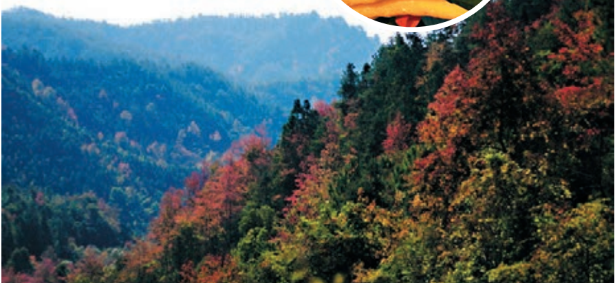
■新豐雲髻山的秋葉一片片紅燦燦。