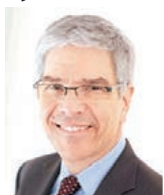
■紐大新聞稿稱羅默是本屆經濟諾獎得主。網上圖片

頁面的記錄。現年60歲的羅默是芝加哥大學經濟學博士，他在1980年代至1990年代間提出「內生增長理論」，認為經濟增長的主要動力來自技術改變，把經濟學界的關注焦點由勞動力和土地資源等，轉移到人才培訓和技術創新上。羅默近期曾發文批評宏觀經濟學派「離地」，只顧提出艱深抽象的理論模型，忽略社會現實。■綜合報道