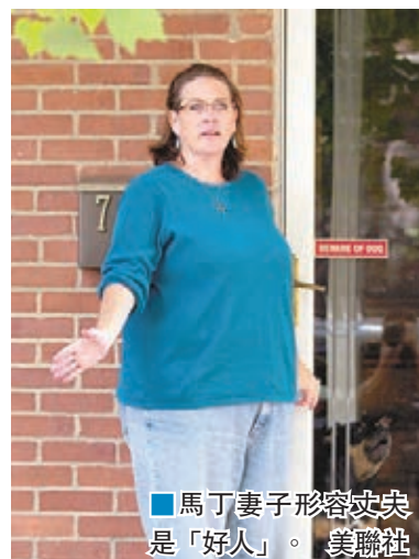
■馬丁妻子形容丈夫是「好人」。

當局表示，至今仍未確定馬丁有否把資料外洩或是交給第三者，抑或純粹是下載後儲存起來。「維基解密」自去年起多次公開文件，披露國安局監控日本及德國等國家，今年8月也有黑客組織在網上公開國安局用於發動網絡攻擊的電子工具，暫時未知與馬丁一案是否有關。