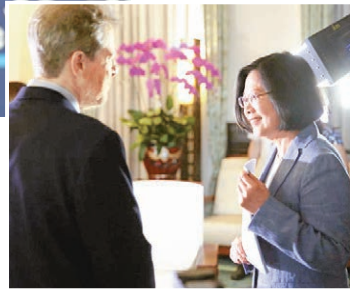
蔡英文接受《華爾街日報》採訪時向大陸喊話，聲稱台灣是「主權獨立國家」。

對於大陸方面是否有回應APEC台灣人選的最終期限，汪曙申表示目前還未得到相關消息，「這與主辦方有關，而根據日前ICAO大會的情況看，提前一個多星期若還沒有收到邀請函，應該就意味着與此次大會無緣。」