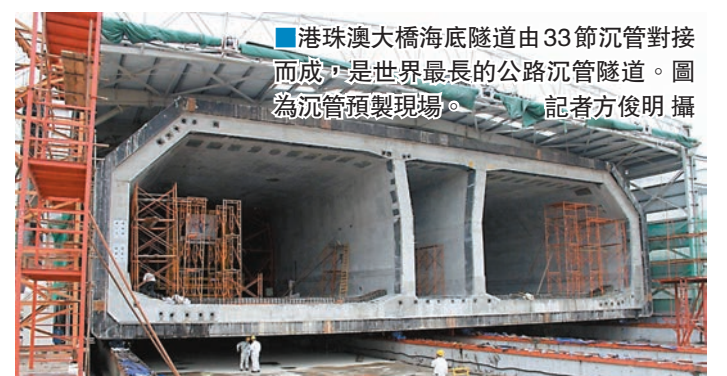
港珠澳大橋海底隧道由33節沉管對接而成，是世界最長的公路沉管隧道。圖為沉管預製現場。

另外，王毅透露，秘魯總統庫琴斯基已向習近平主席發出盛情邀請，並熱切期待習近平主席屆時對秘魯進行國事訪問。王毅此次訪問秘魯，就是同秘方進行戰略溝通，就下一步兩國高層交往作準備。