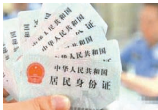
公安部已建成失效居民身份證信息系統並於近日線上線試運行，有效防止身份證被冒用。