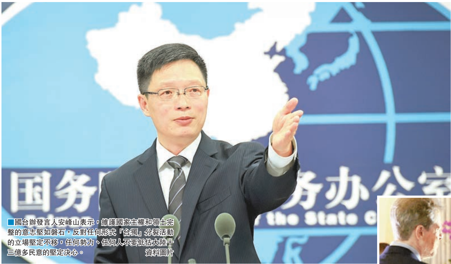
國台辦發言人安峰山表示，維護國家主權和領土完整的意志堅如磐石，反對任何形式「台獨」分裂活動的立場堅定不移，任何勢力、任何人不要低估大陸十三億多民意的堅定決心。

香港文匯報訊(記者 朱輝 北京報道)針對台灣當局派宋楚瑜以「特使」身份出席亞太經合組織(APEC)的決定及蔡英文接受《華爾街日報》專訪時的言論，國台辦連續兩日發聲表示，台灣方面人士出席APEC相關活動應符合APEC有關諒解備忘錄的規定，同時大陸反對任何形式「台獨」分裂活動的立場堅定不移，「任何勢力、任何人不要低估大陸十三億多民意的堅定決心。」