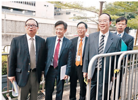
「五散人」與特首會面後見記者。