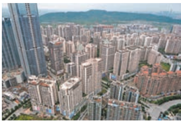
國慶期間，多地出台調控措施，南寧市政府昨日也發文調控措施。圖為南寧東盟商務區的高樓大廈。

而通過提高購房首付比例，特別是提高了二套房首付比例，不僅直接減少購房需求，還能降低銀行信貸風險。劉洪玉認為，目前參與房地產開發的除了開發企業自有資金外，還有銀行、債券、證券、理財產品、信託