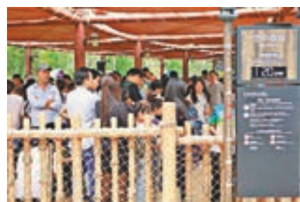
大型遊玩項目均需排隊2小時或以上。

香港文匯報訊(記者 趙臣 安徽報道)國慶期間,於9月24日開業的安徽合肥萬達文化旅遊城迎來了首個旅遊高峰。據統計,3日,文化旅遊城中包括水樂園、電影樂園和主題樂園等項目共接待遊客總數突破40萬人次。