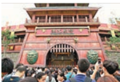
萬達樂園內的《淝水劇場》門前排滿了遊客。

以徽文化為表現主題的合肥萬達主題樂園獨具特色,主題樂園規劃有徽州古韻、梨園春秋、歡樂水鄉、巢州古城、夢蝶仙境、淝水之戰六大主題區域,從區域設置到體驗項目和演藝秀的設計打造等均呈現了徽式特色。古戰爭劇《淝水之戰》,以安徽本地