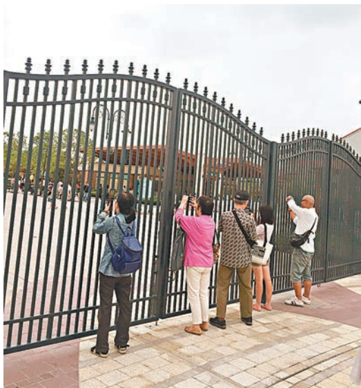
很多遊客不入園,僅隔着大門拍攝園內城堡。

如此情況被曝光後,不少遊客決定錯峰遊園。兩日後,迪園客流逐漸增加。4日,上海迪園官方App數據顯示,午後,「明星項目」雷鳴山漂流最多需排隊4小時,飛越地平線排隊3.5小時,七個小矮人礦山車排隊3小時,創極速光輪排隊時長則達2.5小時。除此以外,多數項目排隊時長都在1小時以內。與「五一」試運營時,動輒排隊五六個小時的狂熱,不能同日而語。惟好景不長,5日迪園客流明顯縮量。下午高