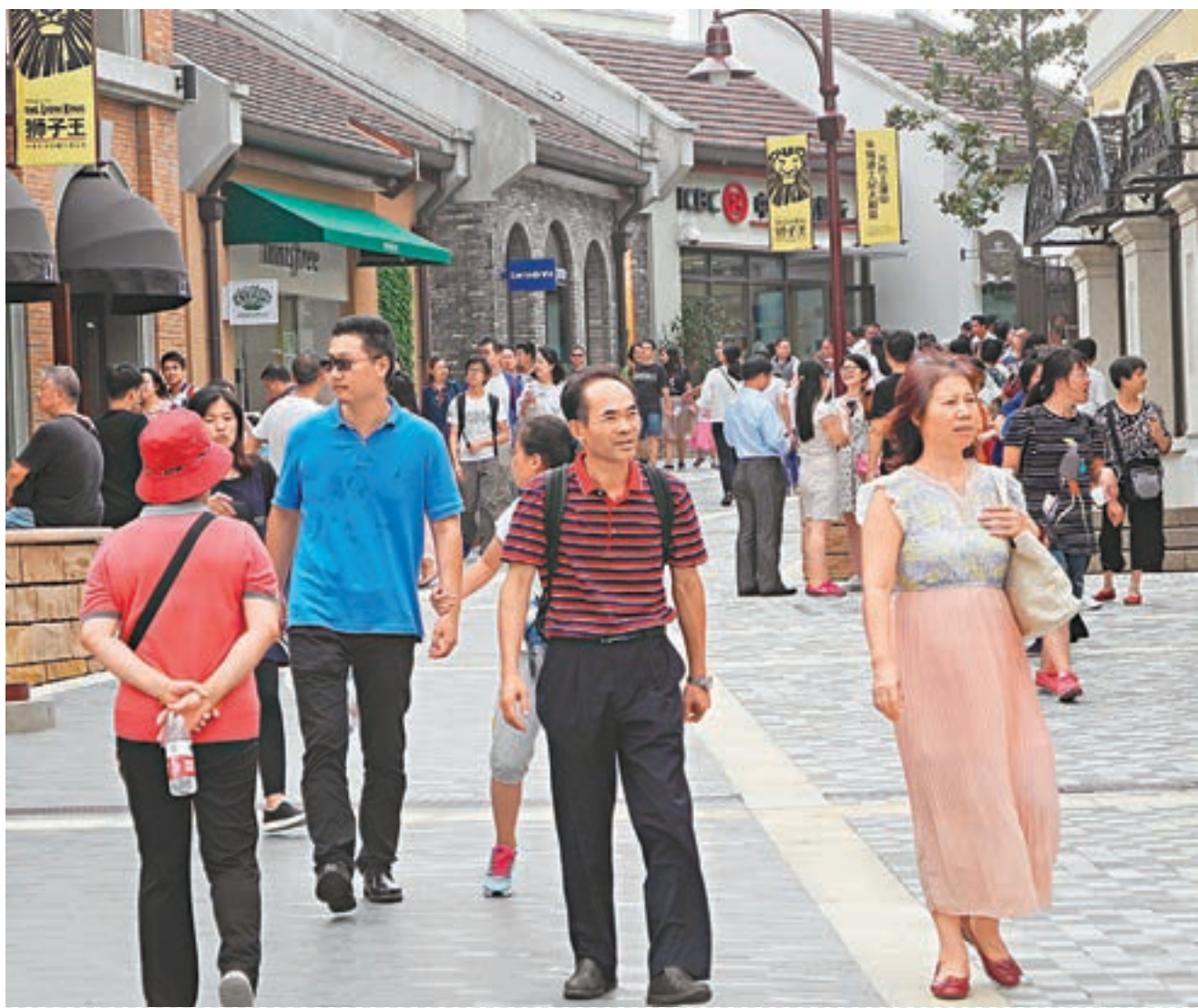
上海迪士尼樂園在國慶黃金周客流未見擁擠。圖為迪士尼小鎮一隅。

開園未滿半年,上海迪園熱潮已經迅速降溫。從目前的運營狀況看,欲藉迪園吸引遊客赴滬,並非易事。上海旅遊局公佈的官方數據指,國慶假期首三天,上海累計接待遊客約455萬人次,同比增長7%。至於早前業界擔憂上海酒店客房數目,或不足應對因迪園蜂擁入滬的遊客,恐怕也是杞人憂天,期內上海旅遊住宿業平均客房出租率僅為68%。