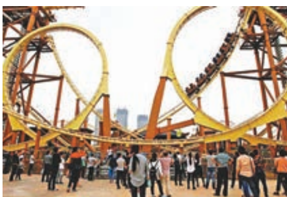
萬達樂園的「龍虎爭霸」過山車是內地首台相對發式雙軌過山車。

連續四天,萬達主題樂園一開園就迎來眾多遊客。記者看到,樂園內包括雙軌過山車龍虎爭霸、環環過山車白龍飛天、大型演出《淝水之戰》等多處遊玩項目目前都排起了長隊。工作人員告訴記者,這些項目基本都需排隊2小時以上。來自海南的王先生國慶期間來合肥拜訪親友,恰逢萬達主題樂園開園,他與朋友通過網絡團購的門票是165元人民幣,值得玩的項目很多,性價比較高。合肥遊客陳女士帶著兒子從早上十點便來到主題樂園,摩天輪、彩蝶飛舞等遊樂項目讓小朋友玩的十分開心。陳女士表示,萬達樂園不到200元人民幣的票價可以玩到這麼多項目,值回票價,兒子當天玩得也很盡興。