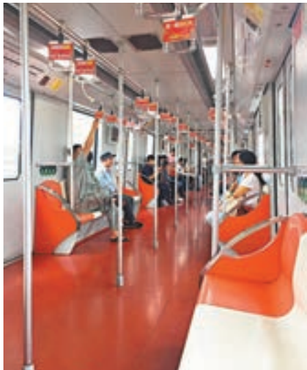
直達迪園的地鐵11號線有不少空位。

香港文匯報訊(記者 章蘿蘭 上海報道)「十一」黃金周當是最熱旅遊季。昨日記者踏上上海迪士尼之旅前原已做好被「擠爆」的準備,但當抵達時卻意外發現迪園毫無「高燒」跡象,「低熱」亦是勉強,各方雖嚴陣以待,但限流措施根本就是多餘。