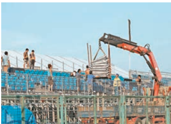
賽道的配套工程如火如荼。