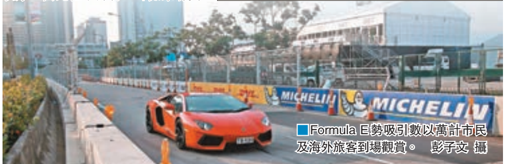
Formula E巨勢吸引數以萬計市民及海外旅客到場觀賞。

她表示,今年首8個月商場零售數據及人流都有上升的趨勢,而接近年底亦會刺激消費者購買的意慾,相信第四季商場生意能逆市上升。