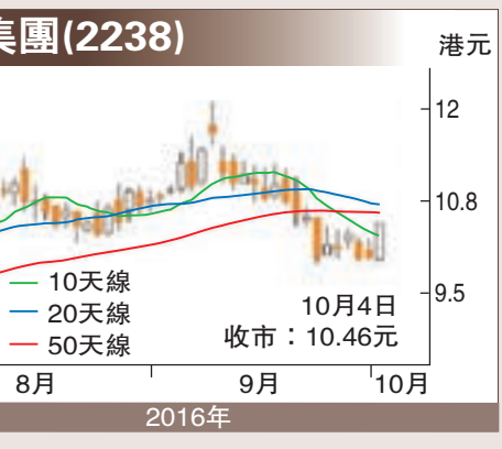
廣汽集團(2238) 10月4日收市：10.46元

傳祺7座高端SUV 下月推售 至於廣汽今年首八個月汽車總銷量為99.07萬輛，較去年同期增長30.4%；總產量為100.87萬輛，較去年同期上升29.9%。集團銷售增長理想，其今年預測市盈率約11.84倍，估值在同業中不算貴。此外，廣汽在杭州生產的廣汽傳祺7座高端SUV GS8在下月26日上市，可進一步提升盈利。